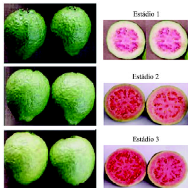
Figura 2. Estádios de maturação de goiabas ‘Pedro Sato’, classificados segundo a cor da casca, em estágio 1 (cor da casca verde-escura, ângulo de cor entre 120 ^{\circ} h e 117 ^{\circ} h), estágio 2 (cor da casca verde-clara, ângulo de cor entre 116 ^{\circ} h e 113 ^{\circ} h) e estágio 3 (cor da casca verde-amarela, ângulo de cor entre 112 ^{\circ} h e 108 ^{\circ} h), no momento da colheita.