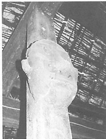
恐ろしい顔の竈神（宮城県加美町）

宮城県や岩手県では竈付近の柱にカマジンと呼ばれる木製の面が掛けられている。恐ろしい顔貌に