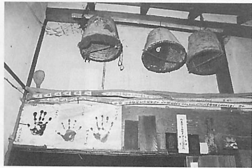
魔除けを期待された米寿の手形（奈良県天理市）

ある。奈良県や三重県などで見られる米寿の手形は、長寿の肉体に宿る生命力を魔除けに転化したものである。節分に焦がした鱈の頭を柊の枝に刺して戸口付近に差し込む習俗は全国的に分布する。寺社が発行する御札を魔除けにする場合も多い。