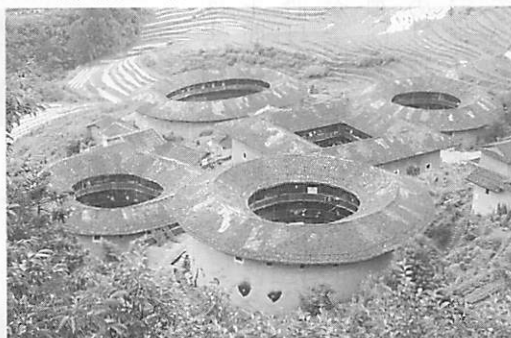
漢民族の土楼（中国・福建省）

高取正男は列島の周縁部に屋敷林に囲まれた住まいが多く分布していることに着目し、かつて森で生活をしてきた名残りではないかと推測した。この当否はともかく、私は高取の指摘した住感覚に注目している。前出のように住まいの閉鎖性は本質的なものであるが、石塀を持つ住まいは住感覚に基づいて伝承されてきた住まいの型、すなわち文化と見ることも可能では