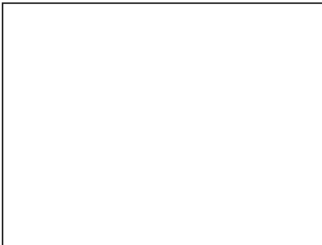
FIG. 2. Aparência externa final dos frutos da mangueira cv. Tommy Atkins submetida a imersão pós-colheita a 46,1°C, por 90 minutos, em 0%, 2,0% e 4,0% de CaCl 2 , armazenada por 22 dias, a 10°C ± 1°C e 85% ± 5% de umidade relativa, e mais quatro dias à temperatura ambiente (mesmo fruto de cada tratamento, em duas posições).