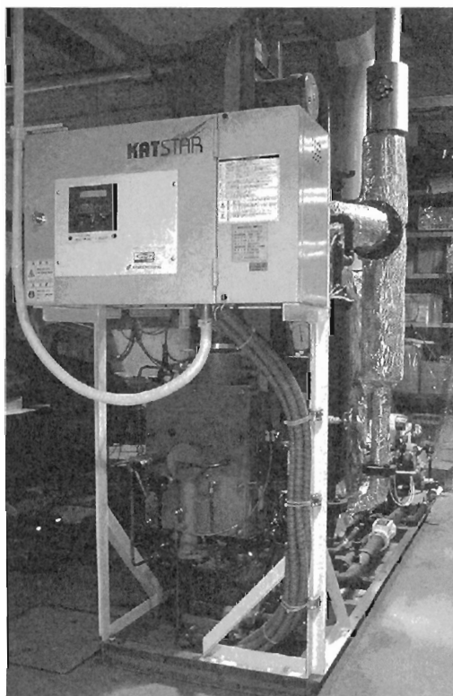
図2 JS-500G-Z管巢燃焼ボイラ（蒸発量0.5t/h）