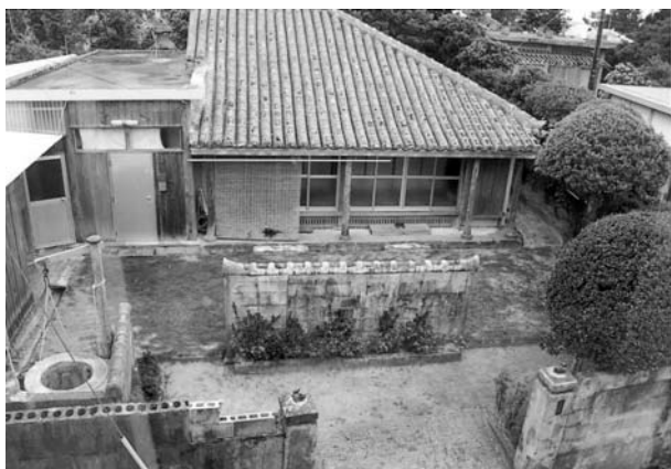
写真13 住居空間におけるヒンプンの位置 (小浜集落)

主屋の三番座に移している。残存している事例でも、現在は物置になっ ている。アサイの前に井戸を掘っている家もある。地下水が豊富な 当地では井戸を掘り、飲料水や生活用水に当てている。井戸の 位置は南東に当たり、風水思想が反映している可能性がある。主屋 の北西にはホリヤと呼ばれる便所があった。この位置に便所が残る 事例は多い。奄美や沖縄地域にみられる高倉が当地に造られること はなかった。