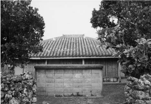
写真4 最も多いブロック製のヒンピン

メートル、幅〇・五メートルである。しかしO氏宅の石製のヒンピンは長さが六メートル、K氏宅の石製のヒンピンには屋根があり、長さが六メートル、高さが一・八メートル、幅〇・九メートルの規模がある。一方、N氏宅の板製のヒンピンは長さ二・五メートルで、軽量であり地面に埋め込んでいないため移動が可能である。このように現在みられるヒンピンは、形態や規模が多様である。