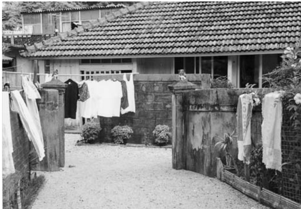
写真10 物干しに利用されるヒンブン (数久田集落)

どの住まいにヒンブンが設置されていた。材料は竹で、それらを編んで縦に立てて目隠しにしたという。戦後は竹製のヒンブンを作る職人がいなくなり、昭和二〇年代に急減した。残ったヒンブンも数本の低木を生垣にする形態に変わっていった。当集落ではコンクリートブロック製のヒンブンは普及しなかった。なお、「浜屋敷」の屋号をもつ旧家には、生垣のヒンブンの根元に、長さ一四三センチ、高さ一七センチ、幅一四センチのサンゴ石で作ったヒンブンの