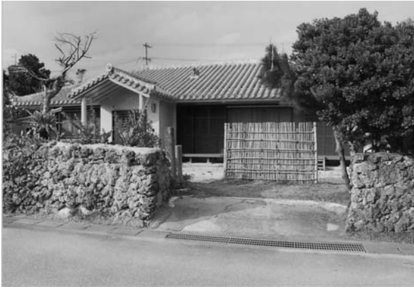
写真5 マイマーキ (本来の竹のヒンブン)