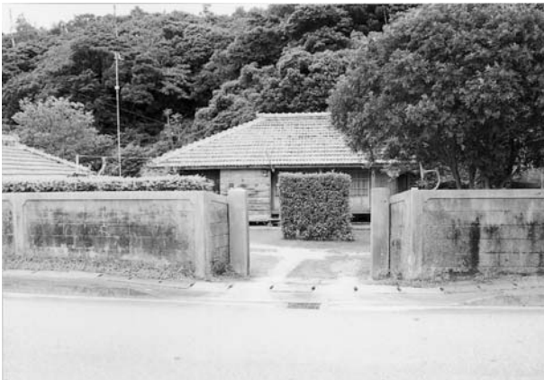
写真12 このように整備されたヒンプンは少ない (山入端集落)

山入端集落も名護湾に面した低地に基盤目状に形成された集落である。昭和五九年に北部工業高校の建築科の生徒によって調査が行