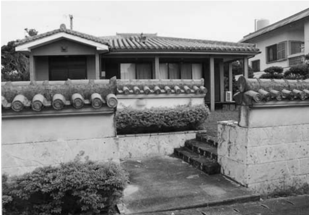
写真8 屋根・ヒンピン・塀を同一の赤瓦で統一した住まい（以上小浜集落）

クリートやブロックなどの新建材が採用され始めた時代でもあった。平成に入り、生垣や板製のヒンピンが増えてきた。スイズ貝を取り付けたり、フラワーポットを置くなど装飾的な要素が加わったのもこの段階である。近年では、屋根と塀、ヒンピンを同一の赤瓦を使用して造った住まいも登場している。 坂本磐雄は八重山地方の集落における石垣やヒンピンなどの敷地囲いが創り出す景観について成果を発表している。小浜集落につい