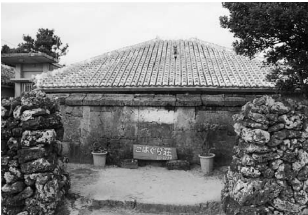
写真2 石のヒンプン 〔「ちゅらさん」の舞台になった住まい〕

今回調査の対象にした小浜集落は屋敷の総区画数一七一で、ほとんどの住まいが南面している。ヒンプンが設置されている屋敷はこのうちの七二で、全体の四二パーセントに当たる。集落の北部に濃厚な分布が認められるが、この地域は比較的早く開発されたといわれる。一般的なヒンプンの規模は長さ約四メートル、高さ一・五