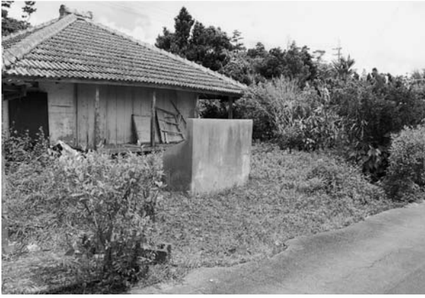
写真11 廃屋に残るコンクリート製のヒンプン (山入端集落)

である。当時少なくとも二三例のヒンプンがあったことが報告書からわかるが、今回は八例を確認したのみである。そのうち七例はブロック製で、一例が生垣であった。ヒチャークヤアの屋号をもつ屋敷には長さ六メートル、高さ一・五メートルのブロック製の大型ヒンプンが設置されていた。