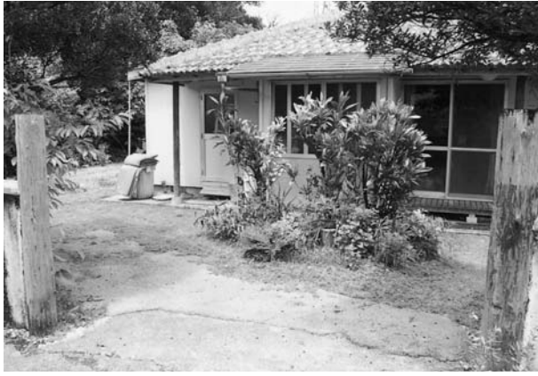
写真9 ヒンブンの名残りを伝える生垣 (嘉陽集落)

どの住まいにヒンブンが設置されていた。材料は竹で、それらを編んで縦に立てて目隠しにしたという。戦後は竹製のヒンブンを作る職人がいなくなり、昭和二〇年代に急減した。残ったヒンブンも数本の低木を生垣にする形態に変わっていった。当集落ではコンクリートブロック製のヒンブンは普及しなかった。なお、「浜屋敷」の屋号をもつ旧家には、生垣のヒンブンの根元に、長さ一四三センチ、高さ一七センチ、幅一四センチのサンゴ石で作ったヒンブンの