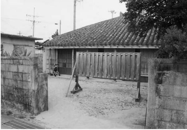
写真7 板製のヒンピン

クリートやブロックなどの新建材が採用され始めた時代でもあった。平成に入り、生垣や板製のヒンピンが増えてきた。スイズ貝を取り付けたり、フラワーポットを置くなど装飾的な要素が加わったのもこの段階である。近年では、屋根と塀、ヒンピンを同一の赤瓦を使用して造った住まいも登場している。 坂本磐雄は八重山地方の集落における石垣やヒンピンなどの敷地囲いが創り出す景観について成果を発表している。小浜集落につい