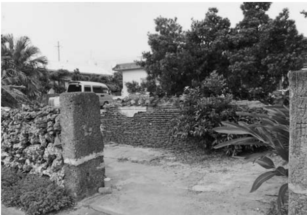
写真6 瓦を土で固めたヒンブン

を設置していた。墓を造った残りの石を使用したともいわれている。サンゴ礁の石を切り出して水牛に引かせて運ぶため多くの労力が必要で、切り石製のヒンブンを設置することは経済力のある家だけが可能であった。また一般の住まいではサンゴ石をそのまま積み上げたヒンブンや、瓦のかけらを土で固めさらに漆喰を塗ったヒンブンもみられた。コンクリート製のブロックを使用したヒンブンは昭和三〇年代の中ごろに登場した。堅牢で手軽にできたため、その