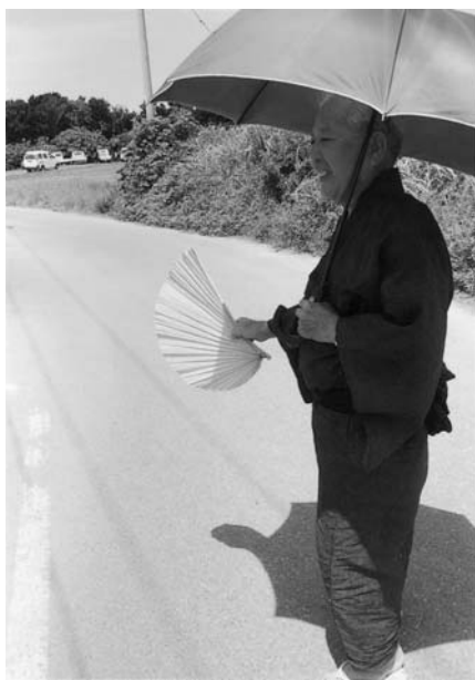
写真14 豊年祭に参加する人はクバの扇を 持つことが求められる(小浜集落)

以上のように住まいとそれを取り巻く空間では、常に東側が上位 と意識される。とくにハレの日はその秩序が明確に意識され、ヒン プンの設置はこの秩序と連動しているといえる。琉球文化圏の住ま いに共通して設置されていたヒンプンについて、変容を視点に検討