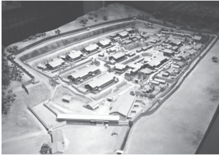
唐人屋敷の模型（長崎歴史文化博物館）