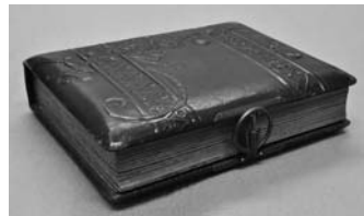
写真10 小倉久アルバム (外形)

このアルバムがどのような状況で作られたかについては、何も伝えられていない。しかしながら写真の裏に記されている西暦(あるいは皇紀)によって判明するもの