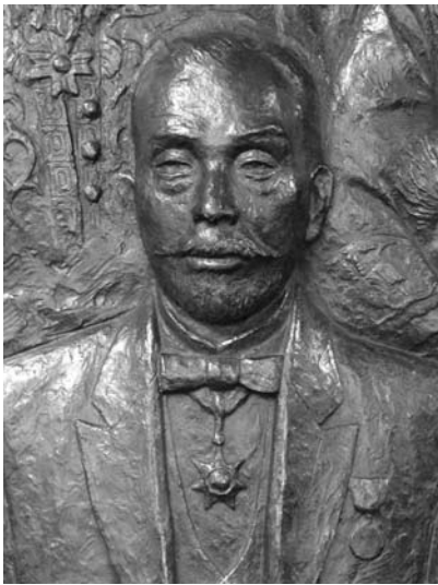
写真9 小倉久（関西大学会館レリーフ）