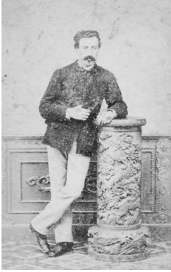
写真13 リベロール