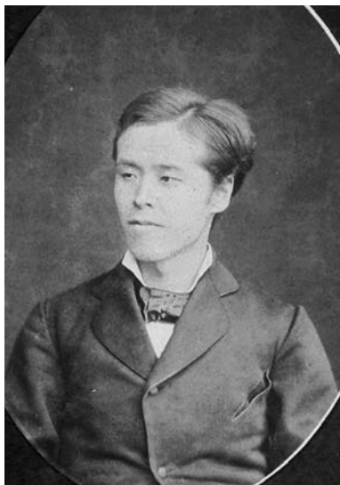
写真23 磯部四郎（明治写真帖）