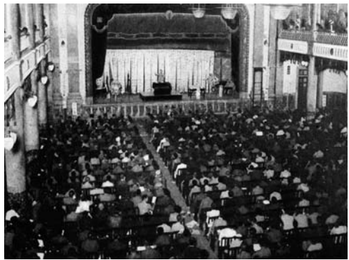
全関西中等学校小学校雄弁大会（中ノ島中央公会堂）

何かと一歩他に先んじてと考える考え抜いて、上品な方法で効果をあげるようにと頭を絞つて次のような方法で進みました。その第一は全府下の小、中学校珠算大会。これは (3) 大阪商業会議所の後援で中央公会堂の二階ホールで行いました。これが前期の大きな催しでありました。この日の結果はB・Kから夕方の放送に組まれるほど権威を持つていましたが、商業会議所が私学のために名を出すということが相問題になりました。私も若かったので心臓も相当なものだったでしょう。会議所の理事