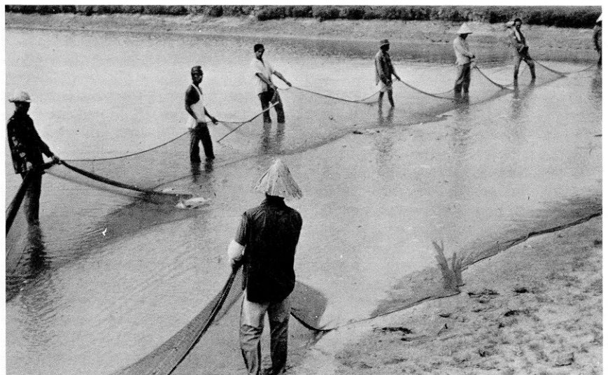
La prise des carpes à la Station de recherches MARDI.

Mais une des difficultés éprouvées jusqu'à présent par la station réside dans les faibles quantités de poissons "sexuellement matures" dont elle dispose. Il se