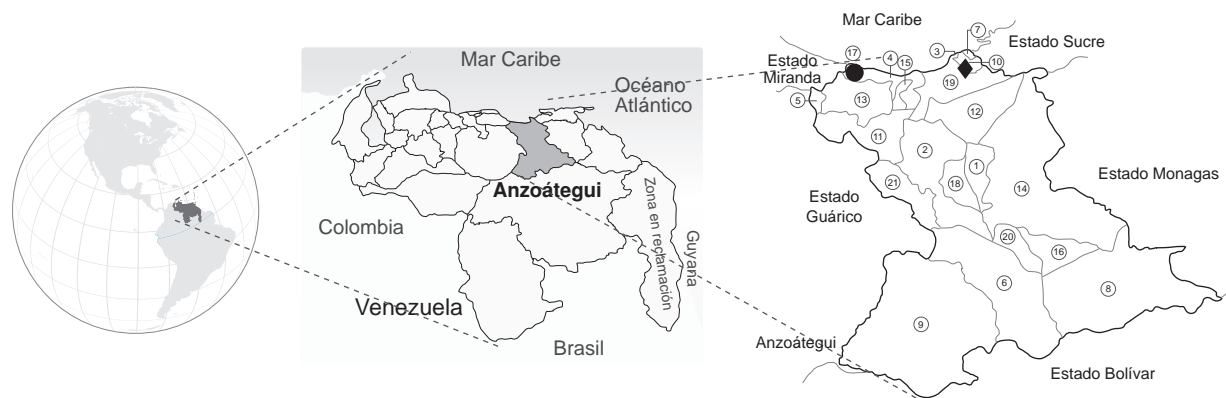
Figura 1. Mapa de Venezuela donde se resalta la ubicación del estado Anzoátegui y, en este, los municipios del estudio. (♦) Municipio de Juan Antonio Sotillo, comunidad de Boquerón; (●) municipio de San Juan de Capistrano, comunidad de Punto Lindo

Se determinó la seroprevalencia por sexo y edad y se compararon los siguientes factores de riesgo epidemiológico en los individuos seropositivos (casos) y en los seronegativos (controles): conocimiento de la enfermedad, tenencia de cerdos no confinados, inadecuada disposición de excrementos, consumo de carne de cerdo semicruda y antecedentes de teniasis, así como los posibles signos y síntomas indicativos de la enfermedad, tales como cefalea frecuente, convulsiones, trastornos mentales, problemas de visión y cuadros epilépticos.