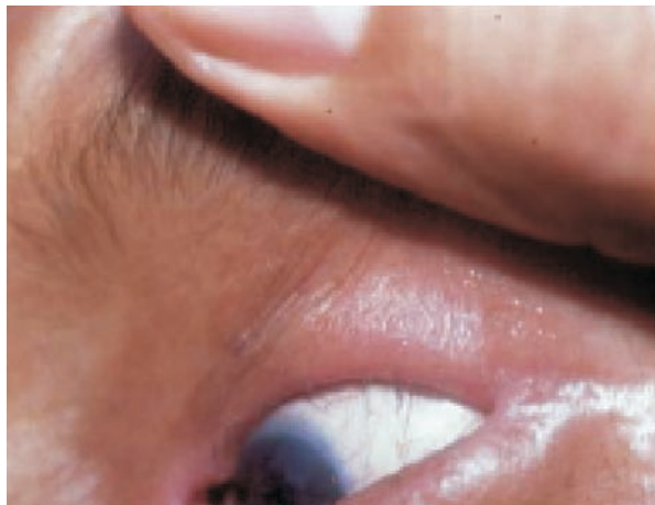
Figura 8. Triquiasis (orientación de las pestañas superiores hacia el interior del ojo) y madarosis.