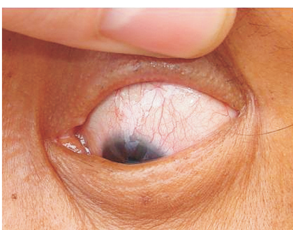
Figura 6. Proliferación de la queratitis vascular, o paño vascular, y madarosis (pérdida de las pestañas)

de muestras ni procedimientos invasivos. En las comunidades de San Joaquín y Santa Catalina, la población presente en el momento de la visita se trató con azitromicina (13-16).