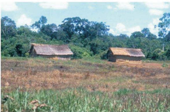
Figura 2. Viviendas de la comunidad de Santa Catalina.

• Inflamación folicular por tracoma: presencia de cinco o más folículos en la conjuntiva del tarso de no menos de 0,5 mm.