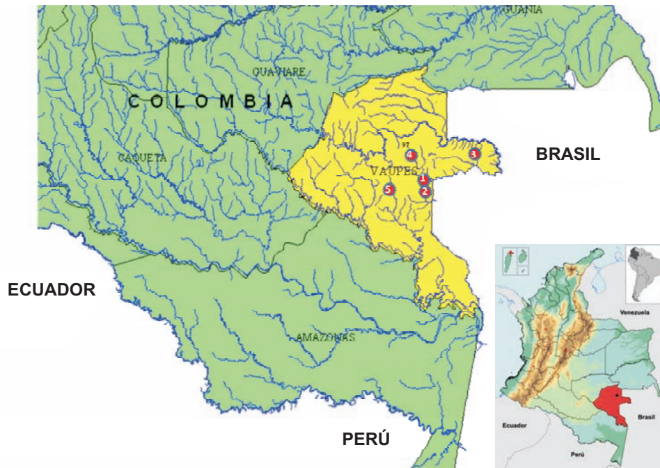
Figura 1. Área geográfica del estudio. En el departamento de Vaupés se marcan con rojo y se numeran las comunidades afectadas por tracoma: 1, San Joaquín; 2, Santa Catalina; 3, Pueblo Nuevo; 4, San Gerardo, y 5, San Gabriel.