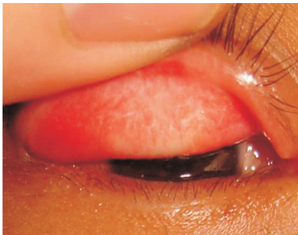
Figura 7. Cicatrices por tracoma, irregulares y blanquecinas.