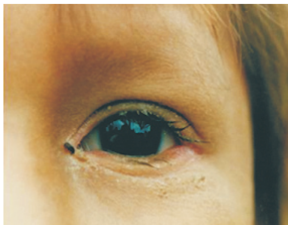
Figura 4. Hippelates sp. adherida a la secreción palpebral