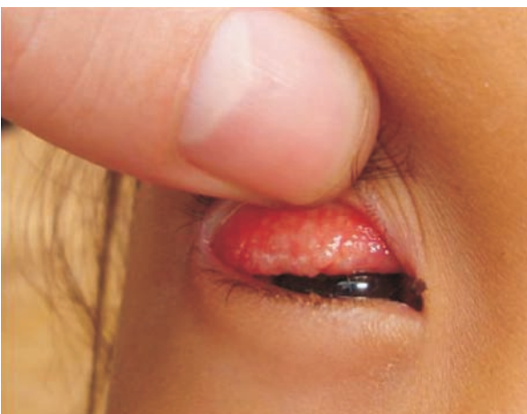
Figura 5. Foliculos blanquecinos de inflamación intensa por tracoma, obliteración de la circulación venosa en la conjuntiva del tarso y presencia de Hippelates sp. en el ángulo interno del ojo.