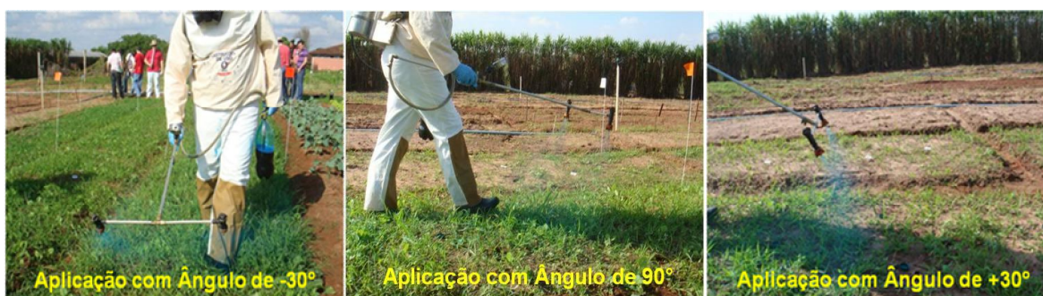
Figura 1. Representação esquemática da aplicação do herbicida+traçador com diferentes angulações de inclinação das pontas de pulverização no sentido do deslocamento da aplicação (+30°; 90°; -30°).

Nas caldas de aplicação foi adicionado como traçador da pulverização o corante FD&C-1, na concentração de 1500 ppm, conforme metodologia descrita por Souza et al. (2007) e Maciel et al. (2007). Palladini et al. (2005) mencionam que o corante FD&C-1 não altera as características físicas da calda, podendo ser utilizado como traçador para simulação de aplicações de herbicidas.