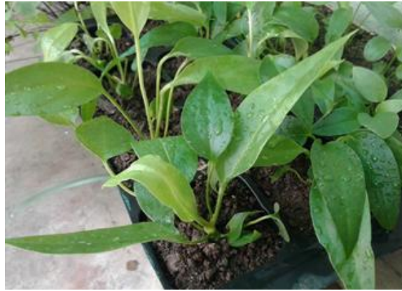
Figura 5. Plantas de Anthurium cubense Engler aclimatizadas en casa de cultivo a los 45 días de plantadas.

cada uno con una duración de 15 minutos. Los horarios de riego deben ser: el primer riego entre las 9:00 y 10:00 am y el segundo posterior a las 4:00 pm. La duración de esta fase es de 90-120 días. Los porcentajes de supervivencia alcanzan el 95% (Figura 5).