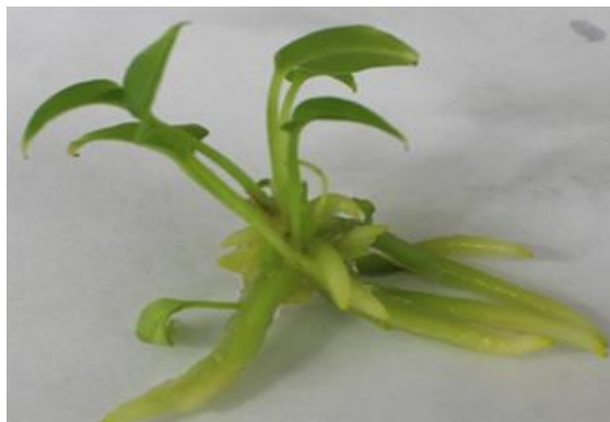
Figura 4. Planta de Anthurium cubense Engler a los 30 días de cultivo en fase de enraizamiento.