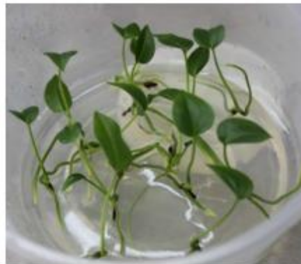
Figura 2. Plantas in vitro de Anturium cubense Engler con 20 días de cultivo, obtenidas a partir de semillas germinadas in vitro .

Medio de cultivo: Sales MS 4.3 g l -1 , tiamina HCl 1.0 mg l -1 , mio-inositol 100 mg l -1 , 6-Bencilaminopurina (6-BAP) 4.0 mg l -1 , Ácido Indol Acético (AIA) 0.65 mg l -1 , sacarosa 30 g l -1 , agar 3.8 g l -1 , pH 5.8.