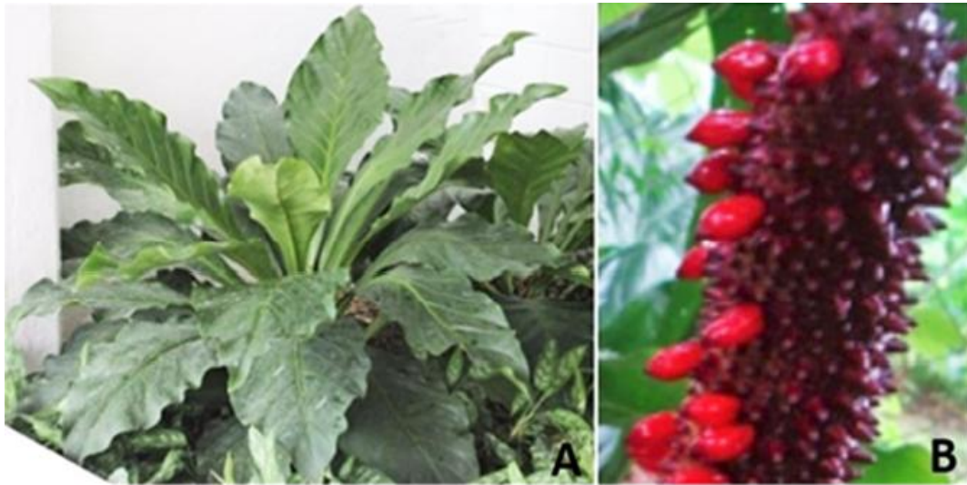
Figura 1. Material vegetal de partida para la propagación in vitro de Anthurium cubense Engler a partir de semilla botánica. A. planta madre, B. inflorescencia y frutos.