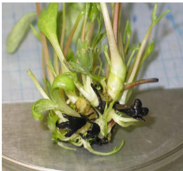
Figura 2. Brotes de Paeonia var. 'SeSu' después de cinco semanas de cultivo en Sistema de Inmersión Temporal.

Al comparar el efecto del tipo y concentración de citoquininas en la propagación de Paeonia var. SeSu en el cultivo en inmersión temporal, los mayores coeficientes de multiplicación se encontraron con las concentraciones de 4.44 y 6.66 \mu\text{mol l}^{-1} de meta-topolina y 6.66 \mu\text{mol l}^{-1} de BA, sin diferencias significativas entre ellos. Esta variable estuvo por encima de 5.0 y a la mayor concentración de citoquinina (6.66 \mu\text{mol l}^{-1} ) se elevó hasta 6.8. Ambas citoquininas mejoraron la longitud del brote principal. Con relación al número de hojas por brote la mayor concentración de BA disminuyó significativamente este indicador morfológico (Figura 3). En cuanto a la longitud del brote principal no se encontraron diferencias significativas entre las dos citoquininas estudiadas, a las diferentes concentraciones evaluadas. No se encontraron síntomas de hiperhidricidad en los brotes. En presencia de BA se eliminó el callo en la base de los brotes. Sin embargo, con 2.22 \mu\text{mol l}^{-1} se presentaron brotes con desarrollo anormal de las hojas.