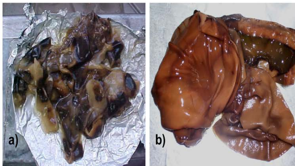
Figura 3. Micelio del aislado de A. solani CCIBP-VAs 4 en medio de cultivo líquido a) medio de cultivo Fries y b) medio de cultivo Richard.

Con los resultados mostrados se profundizan los de este autor quien informó que para la utilización de los filtrados fitotóxicos de A. solani debe estudiarse la relación entre el medio de cultivo, el genotipo hospedante y el aislado.