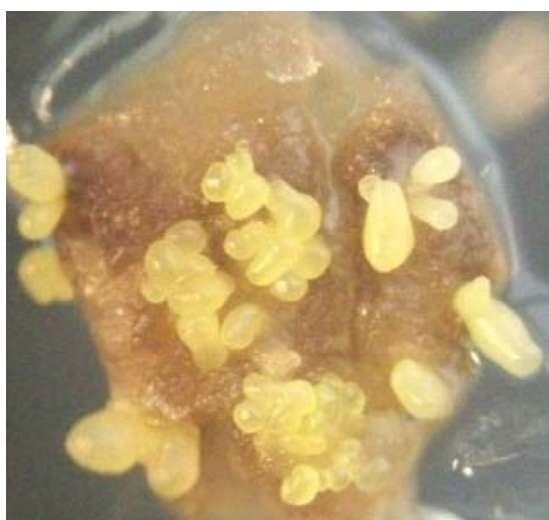
Figura 1. Embriogénesis somática directa en Glycine max variedad Incasoy-27 a partir de cotiledones inmaduros en medio de cultivo con 40\text{mg.l}^{-1} de 2,4-D a los 21 días de cultivo.

Se comprobó que la longitud de los cotiledones influyó sobre la formación de los embriones. Con explantes de 3 a 4 mm a los 14 días se incrementó significativamente en más de un 20% la formación de embriones con respecto a los de 2mm y a los 21 en más de un 35% (Tabla 1).