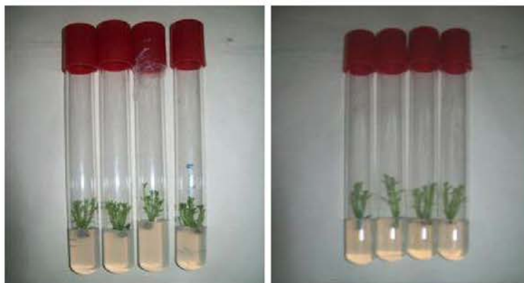
Figura 4. Segmentos nodales en la fase de multiplicación in vitro de Citrus aurantifolia en el medio de cultivo (A) MS + 1 mg l -1 AG 3 + 2.0 mg l -1 6-BAP y (B) MS + 2.0 mg l -1 AG 3 + 1.0 mg l -1 6-BAP.

Otros autores han informado del uso de otras combinaciones de reguladores del crecimiento en la multiplicación de especies de cítricos. Por ejemplo, Al-Khayri y Al-Bahrany (2001) en la micropropagación de Citrus aurantifolia emplearon un medio de cultivo MS con 1.0 mg l -1 y 0.5 mg l -1 de kinetina donde obtuvieron ocho brotes por segmento nodal. De igual forma, Rathore et al. (2007) lograron mayor producción de brotes en el medio de cultivo MS con 5.0 mg.l -1 6-BAP en la multiplicación de Citrus limon .