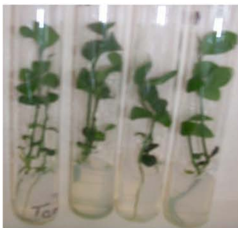
Figura 2. Plantas in vitro de Citrus aurantifolia en la fase de establecimiento en el medio de cultivo basal MS sin la adición de reguladores del crecimiento.