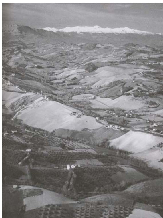
Figura 3. La strada per Turrivalignani, Pescara.