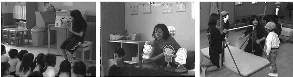
図1：幼稚園児を対象とした指導の様子

幼稚園や保育所などでは、自分の体を十分に動かし、進んで運動しようとする、健康、安全な生活に必要な習慣や態度を身に付けるために、日々、指導が行われている。左から絵本を用いた虫歯予防の指導、ペーパーを使った栄養指導、鉄棒の指導の様子を示している。いずれも、本学の学生が「子どもの研究Ⅱ」の授業内に、附属幼稚園と協力して行ったものである。