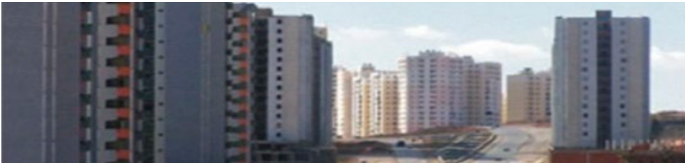
Fig. 2. La Ville nouvelle di Ali Mendjeli.

il programma del governo centrale che prevede entro il 2015 la costruzione nel distretto di altre cinque Villes nouvelles destinate a divenire poli di eccellenza urbana. Ali Mendjeli sorge a circa 15 km dal centro cittadino di Constantine, nel Comune di Ain Smara. La sua realizzazione ha avuto una lunga gestazione: l'approvazione della sua costruzione risale infatti al decreto inter-ministeriale n. 16 del 28/01/1988, confermata con un decreto esecutivo emanato dal Comune di Constantine e da URBA Co ( Centre d'étude & de réalisation en urbanisme de Constantine ) del 25/2/1998, sebbene i lavori di costruzione fossero già iniziati. Secondo URBA Co, manager della progettazione e costruzione, il piano regolatore di Ali Mendjeli prevede la costruzione di altre 62.279 unità residenziali destinate a circa 365.000 abitanti. Alla fine del 2010, con il progetto realizzato al 30,5%, gli abitanti erano più di 68.000. Le tipologie architettoniche consentite dal piano, perfettamente conformi all'architettura residenziale europea, sono costruzioni di 5/6 piani o torri di 13/14 livelli, con una preferenza per lo sviluppo verticale giustificata dal governo come strategia per ridurre la dissipazione dei suoli. L'altra Ville nouvelle del distretto, Massinissa, è sorta nel comune di El Khroub, dalla concentrazione di 10.000 unità abitative, organizzate in Grandes ensembles e in ZHUN , che ospitano attualmente circa 50.000 persone.