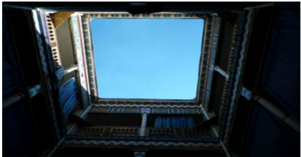
Fig. 3. La corte di un'abitazione nella Medina di Constantine.