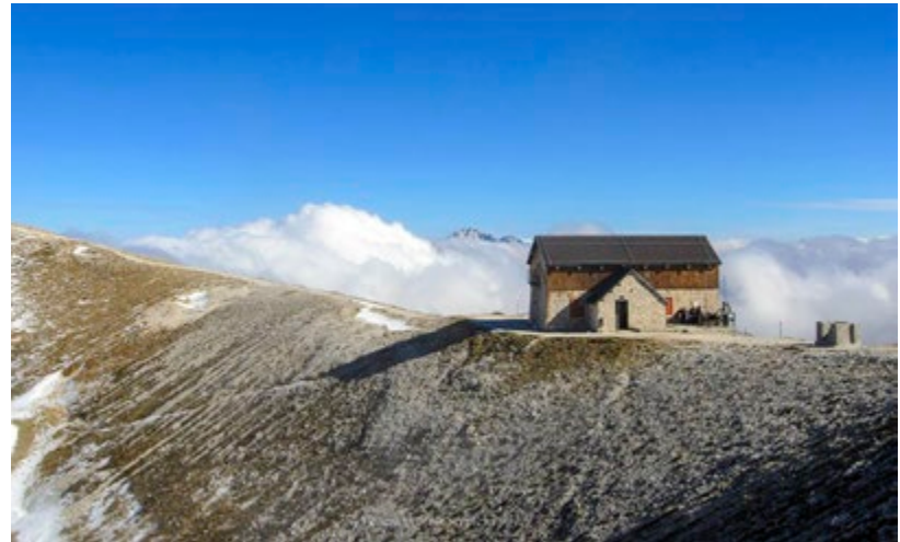
Fig. 4. A sinistra, il Rifugio Sebastiani al Velino; a destra, il Rifugio Duca degli Abruzzi al Gran Sasso.

La realizzazione (e la gestione) dei rifugi può essere considerata un vero e proprio atto territorializzante: comporta la denominazione dei siti, il 'controllo pratico' su di essi, la costituzione di relazioni.