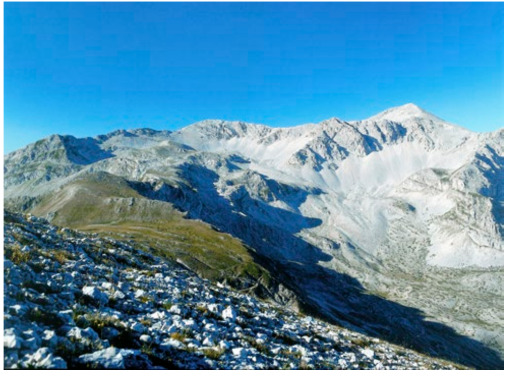
Fig. 2. Monte Velino: morfologie glaciali e vegetazione del piano sub-alpino e alpino.