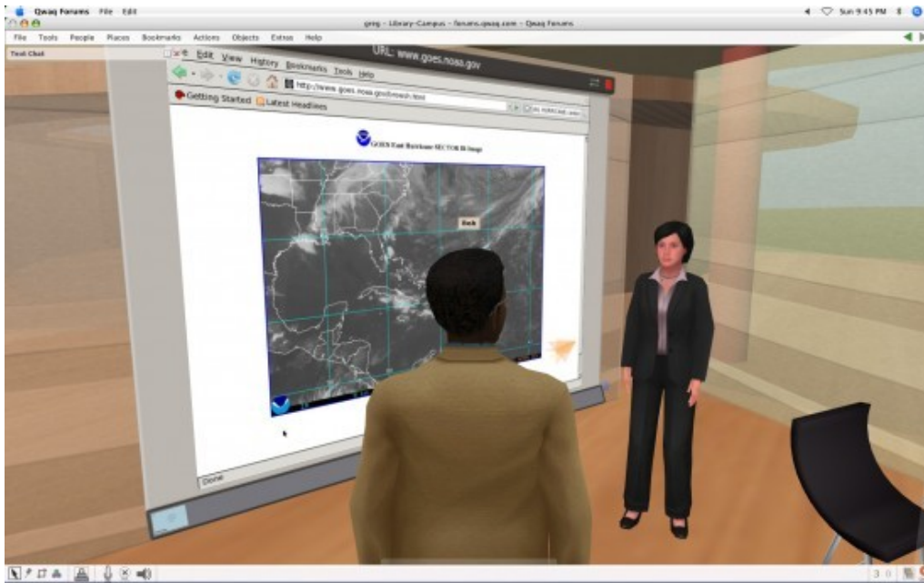
Figura 1. Una tipica vista in Teleplace.

vogliono interagire. L'ambiente di lavoro ( workspace ), viene realizzato da un software che gira su di una macchina collocata nel Web. Ci si incontra, in sincrono, attraverso la rete, in uno spazio virtuale pienamente attrezzato, dove si discuterà a voce e con messaggi di testo, si prepareranno documenti, si prenderanno decisioni. In ciascuna delle proprie sedi i partecipanti stanno davanti allo schermo del proprio computer, come al solito, e operano normalmente nel manovrare gli oggetti presenti sullo schermo (doppio click, drag 'n drop , enter ...), anche se ora si muovono entro una vista non personale, bensì condivisa da tutti.