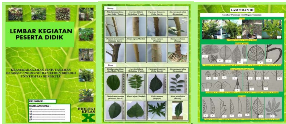
Desain Akhir LKPD