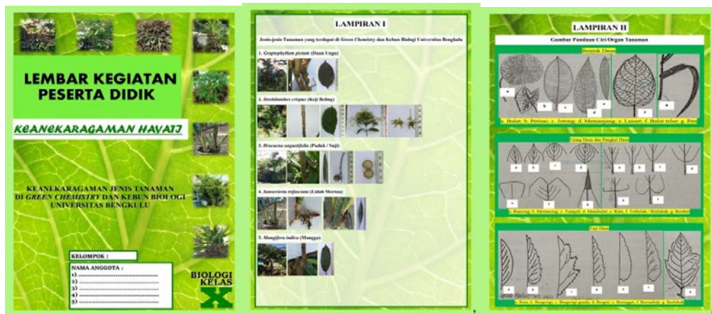
Desain Awal LKPD

untuk mengetahui lebih lanjut mengenai LKPD tersebut. Menurut Kurniawan (2015:14) desain cover harus menarik karena peserta didik akan terlebih dahulu melihat tampilan cover LKPD. Pada isi LKPD terdapat beberapa komponen antara lain kompetensi dasar, tujuan, materi pokok, alat dan bahan, cara kerja, hasil, pertanyaan, dan kesimpulan. Sesuai dengan komponen LKPD yang baik menurut Depdiknas (2008:24).