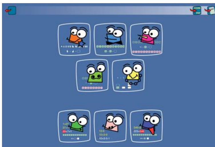
Figura 3. Gli ambienti di GimmeFive.

GimmeFive si compone di otto ambienti riportati in Figura 3.