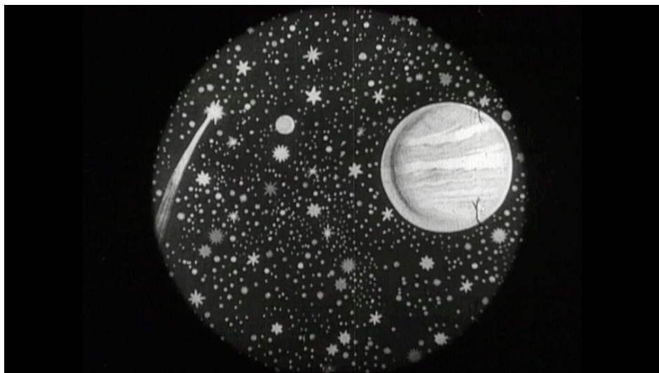
Figura 1. Fotogramma da Matrimonio interplanetario di Yambo (1910).