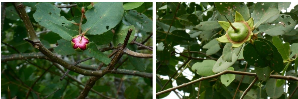
Gambar 1. Bentuk bunga (berwarna merah) dan buah (berwarna hijau) dari tumbuhan mangrove Sonneratia caseolaris di Desa Pasar Sebelah Kecamatan Kota Mukomuko Kabupaten Mukomuko

Ada 3 (tiga) jenis tumbuhan pada ekosistem hutan mangrove di Desa Pasar Sebelah, yaitu Sonneratia caseolaris , tumbuhan nipah ( Nypa fruticans ) dan Crinum asiaticum . Jenis mangrove Sonneratia caseolaris dikalangan masyarakat setempat dikenal dengan nama pedada/pedado. Sonneratia caseolaris mendominasi semua tingkat pertumbuhan dan dijumpai pada semua stasiun pengamatan. Pada lokasi sampling 1 dan 2 ditemukan 2 jenis tumbuhan yaitu Sonneratia caseolaris dan tumbuhan nipah ( Nypa fruticans ), sedangkan pada lokasi sampling 3 ditemukan Sonneratia caseolaris , tumbuhan nipah ( Nypa fruticans ) dan Crinum asiaticum . Menurut Catherine (1993), tumbuhan mangrove jenis Sonneratia ada dua, yaitu Sonneratia alba dengan ciri-ciri antara lain mempunyai bunga warna putih dan Sonneratia caseolaris yang mempunyai bunga berwarna merah.