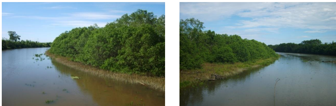
Gambar 2. Lokasi ekosistem hutan mangrove di Desa Pasar Sebelah yang terletak disepanjang aliran Sungai Air Manjuto

Lokasi ekosistem hutan mangrove di Desa Pasar Sebelah berada \pm 2,5 km dari muara Sungai Air Manjuto. Pengaruh pasang surut dan aliran Sungai Air Manjuto membuat ekosistem hutan mangrove di Desa Pasar Sebelah selalu tergenang air. Volume air laut yang masuk dari Samudera Hindia tidak terlalu besar karena mulut muara sungai yang sangat kecil. Hal ini berpengaruh terhadap nilai salinitas air yang menggenangi ekosistem mangrove cukup rendah.