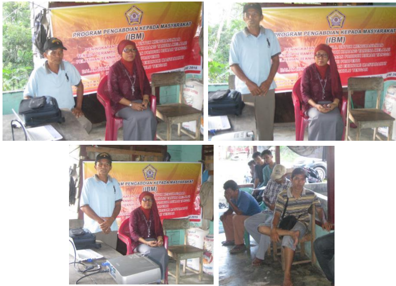
Gambar 7. Pembukaan Pelatihan Pengelasan di Desa Talang Empat

materi pengelasan dan pembukaan kegiatan pelatihan oleh Kepala Desa dapat dilihat pada Gambar 7.