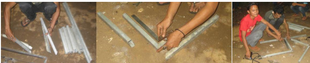
a. Pemotongan Stainless Hollow dan Persiapan Pengelasan

Setelah pembuatan teralis dilanjutkan dengan pembuatan kursi dengan pengelasan stainless dan pembuatan rangka dudukan panel surya. Proses pembuatan kursi dapat dilihat pada Gambar 12 dan hasilnya dapat dilihat pada Gambar 13.