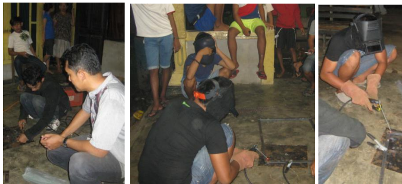
a. Pembuatan Sudut 90 pada Pengelasan Rangka Teralis

Selesai pemberian materi dilanjutkan dengan praktek penggunaan mesin las untuk membuat produk berupa teralis. Pertama dipersiapkan semua peralatan seperti mesin las, elektroda, bahan yang akan dibuat, alat bantu dan pengamanan pada proses pengelasan. Persiapan alat pengelasan. Selanjutnya pembuatan produk teralis dimulai dari persiapan alat seperti mesin las, sarung tangan, pelindung mata, elektroda, kabel dan material las dan dilanjutkan dengan pelatihan. Pada saat pelatihan, peserta harus menggunakan fasilitas pengaman seperti sarung tangan, kaca mata las dan lainnya agar peserta aman dan tidak mengalami kecelakaan saat menggunakan mesin las seperti terlihat pada Gambar 7. Dari hasil pengelasan yang dilakukan peserta, terlihat beberapa peserta sudah dapat menggunakan mesin las untuk membuat atau menyambung suatu benda.