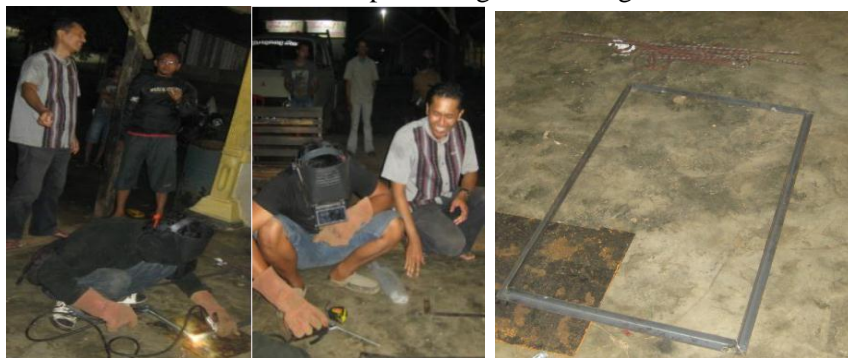
b. Pengelasan Rangka Teralis