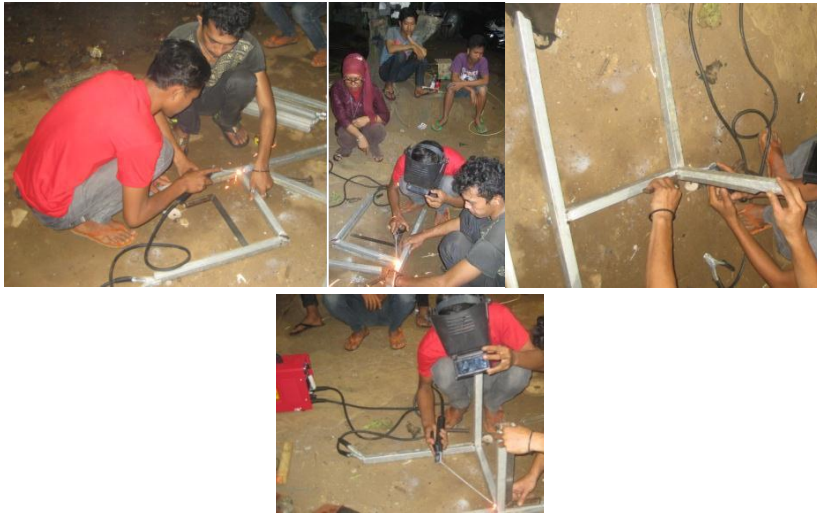
b. Pengelasan Siku untuk Pembuatan Kursi Stainless Steel