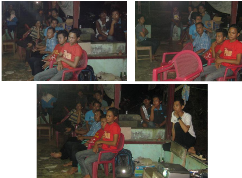
Gambar 9. Peserta Pelatihan Pengelasan di Desa Talang Empat

Setelah pemberian materi kegiatan pelatihan dilanjutkan dengan praktek pengelasan membuat teralis, kursi dari material stainless steel dan rangka dudukan panel surya. Pada pelatihan ini setiap peserta mencoba membuat alat secara bergiliran. Proses pembuatan teralis dapat dilihat pada Gambar 10. Gambar 10 a menunjukkan proses pembuatan sudut siku pada teralis dan pemasangan besi ulir untuk bagian dalam teralis (lihat Gambar 10 b-d).