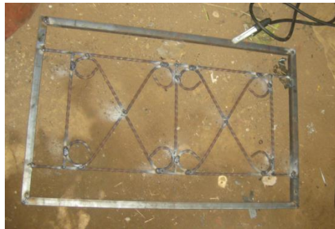
Gambar 11. Produk Pengelasan Teralis

Selanjutnya pada Gambar 10 e hingga Gambar 10 g produk atau bahan dilas menjadi bentuk corak teralis yang diinginkan. Hasil akhir pengelasan teralis ini dapat dilihat pada Gambar 11.