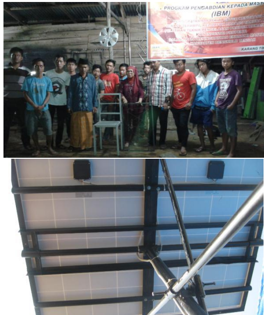
Gambar 13. Produk Pengelasan Kursi dan Panel Surya