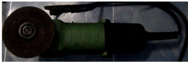
c. Mesin Gerinda Tangan