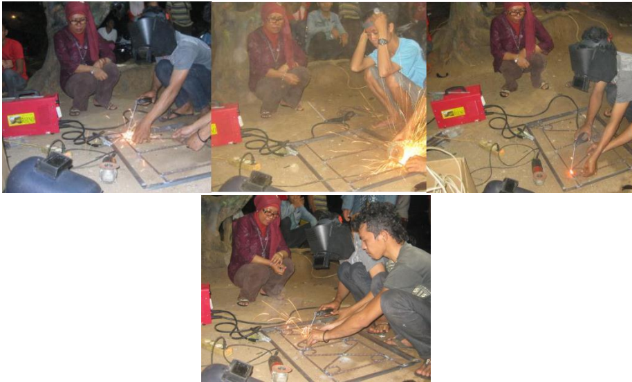
Gambar 10. Proses Praktek Pengelasan Pembuatan Teralis di Desa Talang Empat

Selanjutnya pada Gambar 10 e hingga Gambar 10 g produk atau bahan dilas menjadi bentuk corak teralis yang diinginkan. Hasil akhir pengelasan teralis ini dapat dilihat pada Gambar 11.