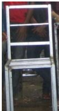
Gambar 2. Model Produk hasil Teknik Pengelasan berupa Kursi Stainless Steel