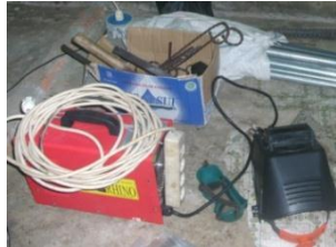
a. Mesin Las

Pelatihan proses pengelasan diawali dengan pengenalan alat-alat las dan peralatan bantu proses pengelasan, benda yang akan dibuat dengan proses las dan jenis-jenis mesin las serta bentuk kampuh las. Alat-alat yang digunakan adalah mesin las TIG yang dapat membuat produk las dari metal maupun stainless steel, mesin gerinda tangan untuk proses potong dan finishing, elektroda, palu, cat dan lainnya yang dapat dilihat pada Gambar 4.