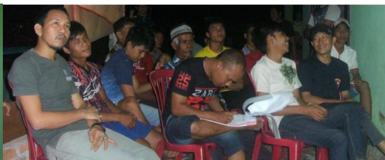
c. Penyampaian Materi Pengelasan