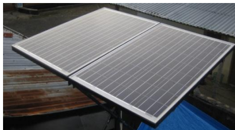
Gambar 3. Model Produk hasil Pengelasan Berupa Rangka Dudukan Sel Surya