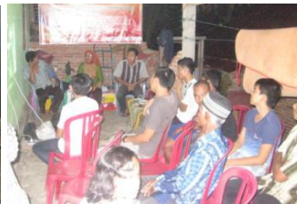
b. Peserta Pelatihan Desa Taba Terujam