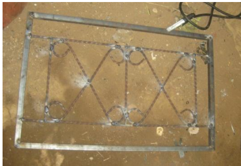
Gambar 1. Produk Pengelasan dengan bahan Besi Siku dan Besi Ulir untuk Teralis

Luaran yang dihasilkan dalam pengabdian masyarakat ini adalah pagar, teralis, gerbang dan jenis produk las lainnya seperti ditunjukkan oleh Gambar 1, 2, 3 dan 4.