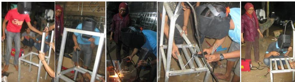
d. Finishing Hasil Las