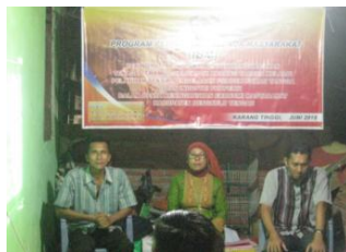
a. Sambutan Kepala Desa Taba Terujam