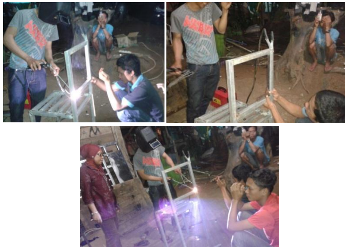
c. Pembuatan Dudukan Kursi