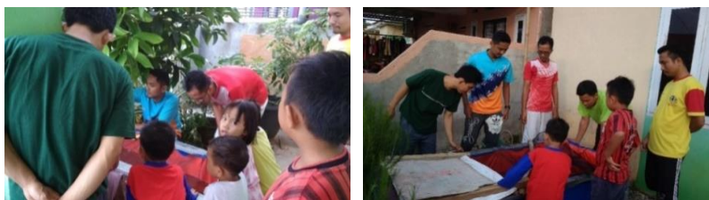
Gambar 4. Penyampaian informasi dan pengenalan kolam portabel kepada masyarakat

Secara keseluruhan, kegiatan ini diharapkan dapat memberikan manfaat kepada masyarakat tentang pemanfaatan lahan pekarangan (Gambar 4). Salah satu pemanfaatannya adalah melalui pembuatan kolam portabel untuk budidaya ikan lele ataupun ikan yang lain seperti ikan nila dan gurami. Keberhasilan kegiatan juga dapat dilihat dari inovasi warga melalui saran untuk pembuatan sistem budidaya tanaman sayuran berbasis hidroponik dengan memanfaatkan air pada kolam portabel. Ini sangat mungkin untuk dilakukan mengingat air tempat budidaya ikan sangat kaya nutrisi yang dibutuhkan oleh tanaman.