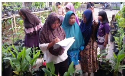
Gambar 4. IRT melaksanakan pemeriksaan dan perawatan tanaman

Selama pemeliharaan oleh ibu-ibu sebaiknya tidak mecampur pupuk dengan bahan kimia lainnya sehingga diharapkan dapat menghasilkan tanaman organik yang sehat. Menjelang panen sebaiknya rutin diberikan tambahan pupuk lumpur tinja organik yang baru sehingga nutrisi tidak berkurang dan penambahan penyiraman dengan menggunakan siraman air perasan beras dan larutan bawang merah. Agar hasil panen maksimal sebaiknya dilakukan penyiraman 2 kali sehari selama pemuahan. Lakukan penyemprotan dengan menggunakan pestisida nabati agar tanaman lebih baik dan hindari menggunakan pestisida berbahan kimiawi untuk memperoleh tanaman organik yang sehat.