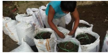
b. Packing media biotin kedalam karung