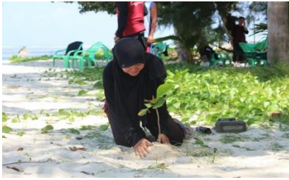
Gambar 6. Penanaman pada kawasan pantai di Kelurahan Berkas