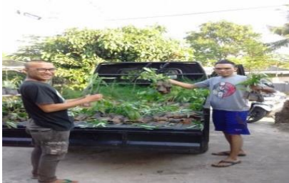
a. Pengangkutan bibit kepada mitra

Tim pembina dan LPM Kelurahan Berkas membagikan bibit tanaman kepada IRT RT 02 dan 03 dengan tujuan memberikan kesejukan dan keasrian rumah pada mitra penerima. Pelaksanaan pemberian bibit dikerjakan selama bulan Juni-Juli 2017. Selain bekerjasama dengan LPM, tim pembina juga bekerjasama dengan mahasiswa KKN yang berkediamaan di lokasi pelaksanaan pembinaan. Gambar 3 menunjukkan pembagian bibit kepada mitra penerima.