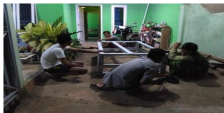
Gambar 1. Pembuatan rangka kolam

Pelaksanaan kegiatan pembuatan kolam portabel dilakukan di warga RT. 03 Kelurahan Sumur Dewa Kecamatan Selebar Kota Bengkulu dimulai pada bulan mei 2018 sampai agustus 2018 dengan jumlah peserta 15 orang. Sebelum ada kegiatan, belum ada masyarakat/warga di RT 03 yang memanfaatkan kolam pekarangan sebagai lahan untuk kolam portabel. Kegiatan ini diawali dengan sosialisasi pemanfaatan lahan pekarangan sebagai tempat budidaya lele melalui kolam portable. Kegiatan dilanjutkan dengan inisiasi/percontohan pembuatan kolam portable di lingkungan RT. 03 sebanyak 4 unit kolam dengan ukuran 2m x 1m di lahan pekarangan Ketua RT. 03, dan beberapa anggota masyarakat (Gambar 1). Antusias dan ketertarikan masyarakat terhadap kegiatan sangat tinggi ditunjukkan dengan kehadiran dan keaktifan bertanya pada saat kegiatan. Kolam didesain dengan bahan rangka baja ringan dan terpal portabel yang sudah tersedia dalam bentuk kolam dengan ukuran 1x2 meter (dipesan melalui situs belanja online).