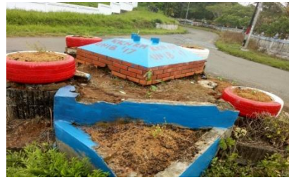
Gambar 7. Hasil penanaman pada kawasan RT H di RT 02 dan 03 Kelurahan Berkas