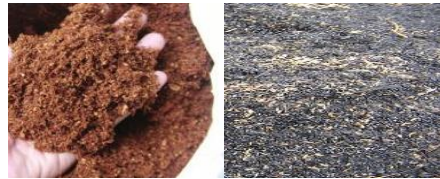
d. Cocopeat dan Sekam Bakar