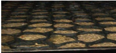
c. Gambar Biotikar dan Biocopeat Campur (dalam Polibag)