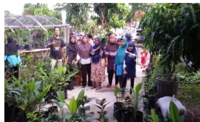
Gambar 5. IRT yang menerima bibit dengan media tanam biotikar dan biococopit