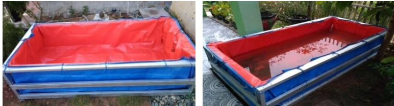
Gambar 2. Kolam terpal yang dibuat dan siap diisi ikan

digunakan dalam jangka panjang. Setelah kolam terpal dibuat, dilakukan pengisian air untuk media ikan. Air diisi dengan volume 1/3 tinggi kolam dengan tujuan sirkulasi oksigen cukup baik sehingga ikan dapat berkembang dengan baik. Kolam yang telah terisi air didiamkan terlebih dahulu dan tidak langsung diisi bibit, ini bertujuan untuk meningkatkan jumlah hewan tingkat rendah seperti fitoplankton dan organisme lain dalam air sebagai sumber makanan bagi ikan. Kolam yang sudah siap diisi ikan ditunjukkan dengan warna hijau pada air kolam (Gambar 2).