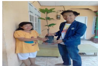
b. Pembagian bibit kepada Ibu RT