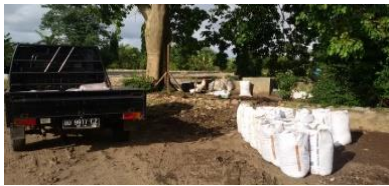
a. Pengangkutan media tanam