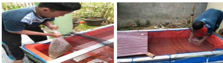
Gambar 3. Kolam portabel yang telah diisi ikan

Bibit ikan lele sangkuriang dipilih dari penjual bibit di sekitar Kota Bengkulu dengan jumlah 500 bibit per kolam (Gambar 3). Pakan awal yang diberikan pada ikan adalah tipe F999 sampai ikan berumur 2 minggu, kemudian 781-2 sampai umur ikan 2 bulan dan 781 sampai umur ikan lele siap panen yaitu 3 bulan. Pemberian pakan berupa pellet pada ikan lele dapat dilakukan dua kali sehari.