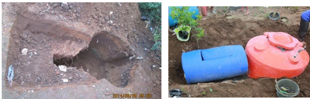
Gambar 7. Lubang dan digester yang ditanam

Setelah semua instalasi biogas dirakit, dilanjutkan dengan pemasangan instalasi biogas pada lokasi kedua mitra. Lokasi dipilih berdasarkan hasil kesepakatan dari seluruh anggota kelompok tani. Pertama-tama dilakukan penanaman tabung digester sedalam \pm 1,5 meter. Digester ditanam dalam tanah dengan tujuan menghindari kebocoran dan lebih aman (Gambar 7).