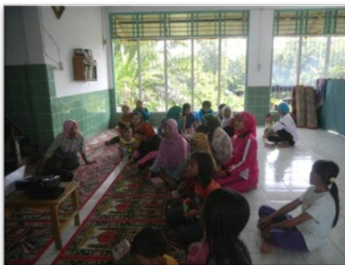
Gambar 1. Kegiatan Penyuluhan terhadap Ibu-ibu/Bapak-bapak Anggota Kelompok Tani Amanah dan Makmur Jaya

Proses pembuatan kompos Takakura sangatlah mudah, hanya saja kita harus menyiapkan starter mikroorganisme dan pembuatan bibit kompos terlebih dahulu. Langkah persiapan ini cukup dilakukan sekali saja, selanjutnya hanya melakukan pengomposan secara terus menerus. Gambar 1 menunjukkan pembuatan keranjang kompos menggunakan kardus aqua, kardus dipleser tegak keempat sisi bawahnya sedangkan sisi atasnya dipotong