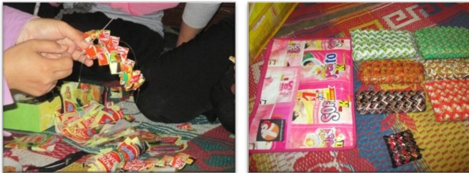
Gambar 3. Pemanfaatan limbah plastik menjadi aneka produk yang bernilai ekonomis

produk yang telah berhasil dibuat pada kegiatan ini berupa dompet, tas dan kotak pensil.