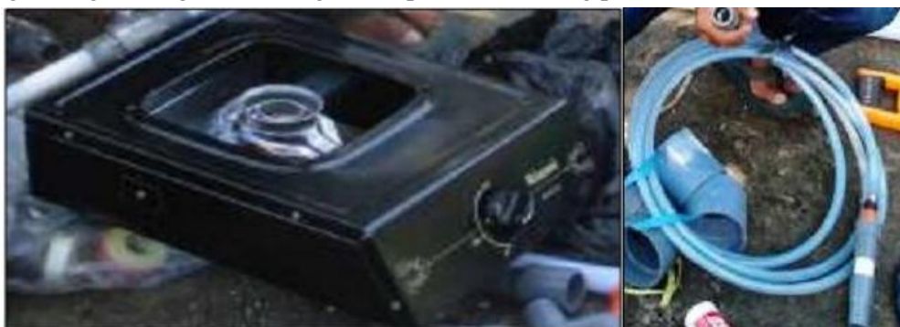
Gambar 6. Kompor gas dan selang untuk kompor gas

Setelah pembuatan digester selesai dilakukan perakitan tungku kompor yang akan digunakan. Kompor 1 tungku yang digunakan adalah kompor komersil yang dijual dipasaran. Tetapi sebelum digunakan pada instalasi biogas, spuyer kompor gas harus dibuka, dikarenakan tekanan biogas khususnya berbahan baku sampah organik ini bertekanan rendah sehingga tidak mampu memompa gas ke burner. Selang yang digunakan sebagai penghubung dari digester ke tungku kompor adalah selang plastik berdiamater ½ inci.