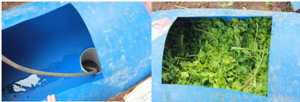
Gambar 8. Proses pengisian air dan sampah sisa sayuran ke dalam digester

Setelah instalasi digester terpasang, dilanjutkan dengan pengisian air dan sampah sisa sayuran yang telah dicacah pada tabung inlet. Air yang diisi harus mampu menenggelamkan sampah sisa sayuran (Gambar 8). Untuk mempercepat proses pembusukan sayuran, ke dalam digester juga dimasukkan kotoran sapi sebanyak 2 ember dan mikroorganisme cair sebanyak 1 liter. Proses pembusukan sampah dan pembentukan gas memakan waktu selama \pm 40 hari. Pada tabung digester tidak boleh masuk cairan yang mengandung bahan kimia seperti air sabun atau detergen karena akan mengurangi bahkan menghentikan pembentukan gas. Terbentuknya gas bisa ditandai dengan adanya gelembung gas pada plastik penampung gas.