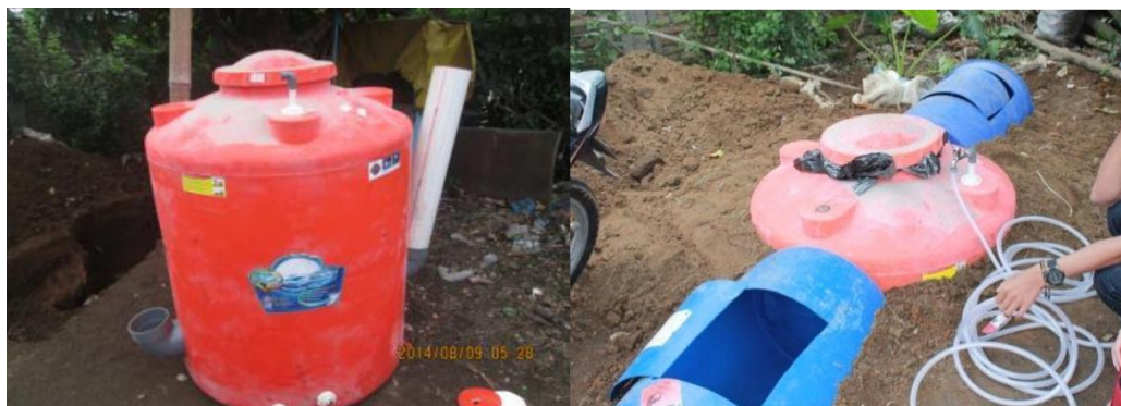
Gambar 5. Bentuk digester yang diterapkan pada kedua mitra

Setelah pembuatan digester selesai dilakukan perakitan tungku kompor yang akan digunakan. Kompor 1 tungku yang digunakan adalah kompor komersil yang dijual dipasaran. Tetapi sebelum digunakan pada instalasi biogas, spuyer kompor gas harus dibuka, dikarenakan tekanan biogas khususnya berbahan baku sampah organik ini bertekanan rendah sehingga tidak mampu memompa gas ke burner. Selang yang digunakan sebagai penghubung dari digester ke tungku kompor adalah selang plastik berdiamater ½ inci.