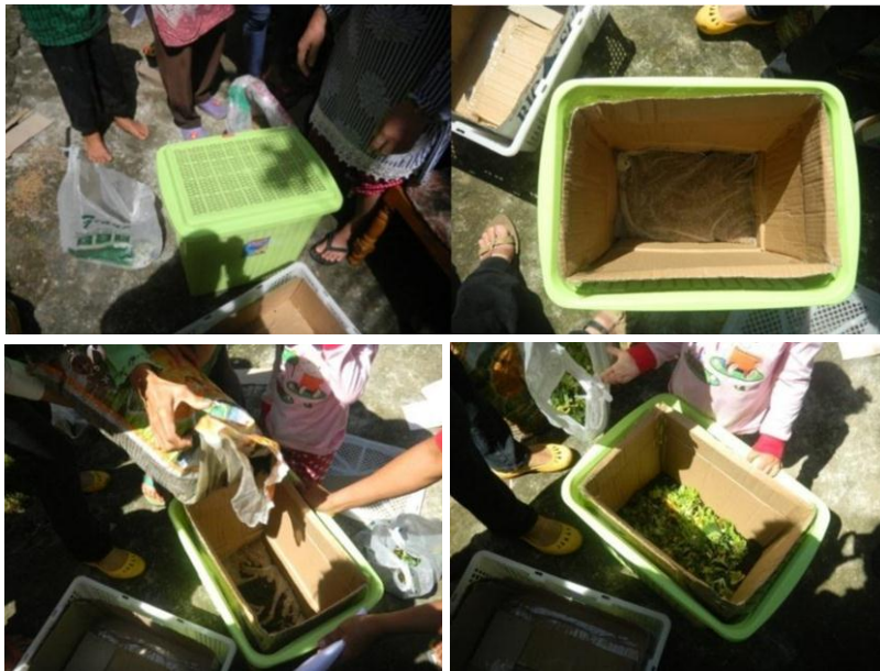
Gambar 2. Pembuatan kompos dengan metode Takakura

Pada kegiatan pelatihan pembuatan produk dari sampah plastik bungkus kemasan dilakukan dengan demonstrasi cara memotong, melipat, menganyam dan menjahit plastik bungkus kemasan menjadi produk seperti tas, dompet dan tempat laptop (Gambar 4). Langkah awal mengolah sampah plastik menjadi kerajinan adalah adalah memisahkan sampah kering dan sampah basah. Selanjutnya sampah kering seperti bungkus minuman ringan seperti kopi, susu dan mie instan dibersihkan. Setelah itu plastik-plastik yang telah dicuci dan dikeringkan kemudian dipotong-potong seperti pola barang kerajinan yang akan dibuat. Pola dibuat sesuai dengan bentuk barang yang akan dibuat. Setelah dipotong sesuai dengan pola, langkah selanjutnya adalah menjahit sesuai dengan pola tersebut. Adapun