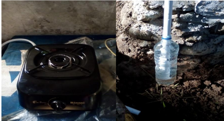
Gambar 7. a) Kompor gas yang sudah terpasang di dapur, b) regulator

kran yang satu dipasang sebelum penampung gas dan stop kran yang kedua dipasang sebelum kompor. Untuk pengamanan dipasang regulator yang terbuat dari pipa yang dicelupkan ke air (Gambar 7b). Regulator ini juga berfungsi sebagai water trap .