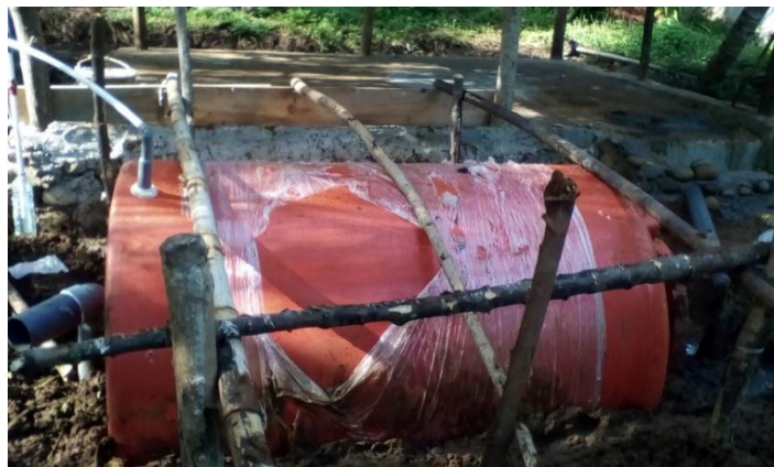
Gambar 6. Digester yang ditanam dalam tanah

Pertama dijelaskan kepada mitra bahwa kotoran sapi dapat diolah menjadi biogas. Biogas dapat digunakan untuk keperluan memasak. Setelah itu dijelaskan komponen instalasi biogas yang akan digunakan mitra. Lalu dilanjutkan dengan pemasangan instalasi dengan melibatkan mitra. Pemasangan instalasi dimulai dengan pemasangan digester. Digester ditempatkan di lokasi yang dekat dengan sumber feed . Tujuannya adalah memudahkan waktu pengisian digester. Digester ditanam dalam tanah dengan tujuan menghindari kebocoran dan lebih aman (Gambar 6).