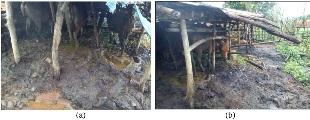
Gambar 2. Kondisi kandang sapi salah satu mitra

a) Kandang Sapi Keluarga Gimán, b) Kotoran sapi sumber limbah