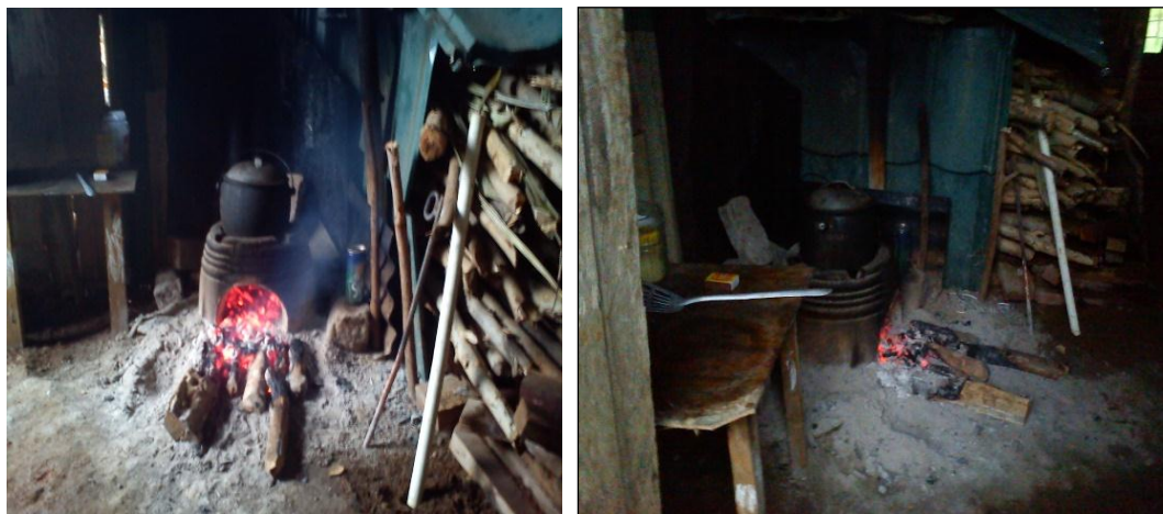
Gambar 1. Kondisi dapur salah satu mitra

Kelangkaan dan kenaikan harga LPG 3 kg begitu terasa dampaknya bagi warga petani/peternak yang ada di Kelurahan Pematang Gubernur dan Kandang Limun yang keberadaannya sudah mulai tersingkir dengan kehadiran beberapa perumahan yang banyak muncul belakangan ini. Bahkan beberapa dari mereka, tidak lagi menggunakan LPG 3 Kg dan beralih menggunakan kayu untuk keperluan memasak sehari-hari (Gambar 1). Kondisi inilah yang mendorong tim untuk mencari solusi yang tepat bagi petani/peternak lainnya dengan memanfaatkan potensi yang ada.