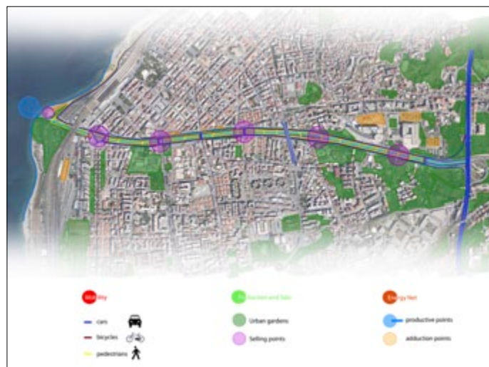
02 | Analisi dell'area oggetto del caso-studio Analysis of the case-study area