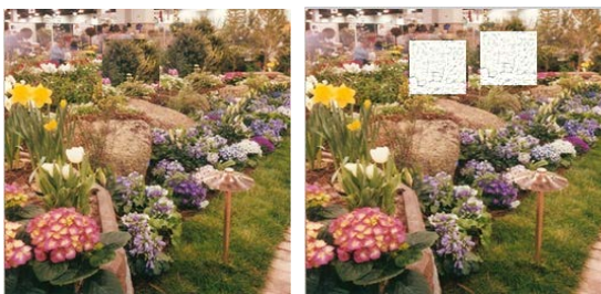
(b) Citra palsu duplicated region