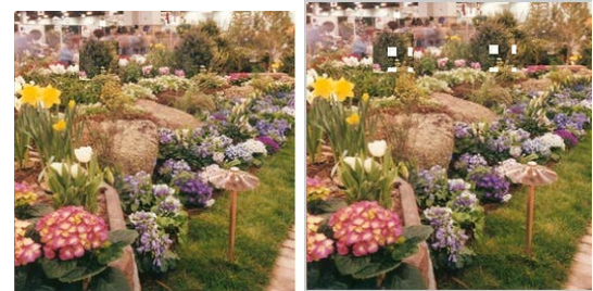
(d) Skala 0.9