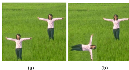
Gambar 1. Citra (a) wilayah terduplikasi (b) rotasi wilayah terduplikasi.

Ketujuh metode tersebut menggunakan fitur spesial untuk mencocokkan dua buah blok region . Metode tersebut terbukti robust terhadap operasi post-processing . Namun teknik yang ada memiliki keterbatasan, ketika salinan wilayah dirotasi maka pencocokan blok akan gagal. Terlihat pada gambar 1.(b) blok duplikat dapat tidak terdeteksi karena kegagalan metode tradisional.