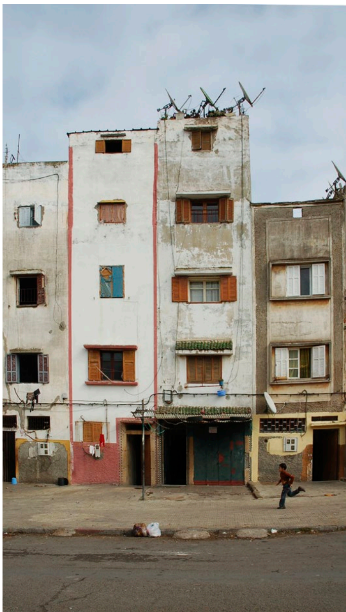
08 | L'habitat évolutif di Derb Jdid di Elie Azagury a Casablanca, il tipo a schiera Omer. Evoluzioni dei processi di socialità del quartiere attraverso la trasformazione dei piani terra, originariamente residenziali, in attività commerciali, foto di Silvia Mocci, 2012 The habitat évolutif of Derb Jdid by Elie Azagury in Casablanca, the terraced type Omer. Evolution of the social processes of the neighbourhood through the transformation of the ground floors, from their original purpose, which was residential, to the new use for commercial activities, photos by Silvia Mocci, 2012

Gli interventi presentati in questa sede hanno dunque un valore paradigmatico sia come modelli morfo-tipologici che come possibili modelli di autosostenibilità 7 delle culture abitative e di conseguenza di nuovi dispositivi generativi di socialità e di integrazione.