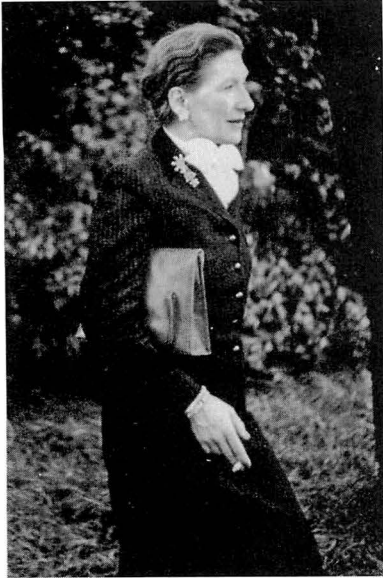
写真1 Elizabeth in Regent's Park, London, 1946. How Will the Heart Endure 扉横ページより

ンが、ヴァージニア・ウルフの繊細な美しさに対して、‘handsome’と表現したことで知られるボウエンの堂々として冷たくさえ見える肖像(写真1)に、熱い血がめぐり始めたように感じられたものである。