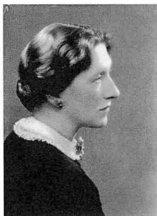
Elizabeth Bowen (1939)

成果の一部である。平成20年10月Royal Irish Academyの学会“The Big House in Twentieth Century Irish Writing”に参加できたことを、併せて感謝したい。