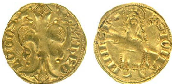
Fig. 5. Teologo (Altoluogo, vicino ad Efeso in Anatolia), Omar Bey (1341-1348), fiorino d'oro, gr. 3,51.