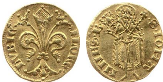
Fig. 4. Lubecca, monetazione della città (dal 1343 in poi), fiorino d'oro, gr. 3,49.

La diffusione della moneta d'oro in Europa dal Duecento in poi fu un aspetto molto importante della cosiddetta rivoluzione commerciale del medioevo. Anche se lo sviluppo di nuovi metodi di pagamento diminuì in parte la necessità di moneta coniata nel commercio 32 , queste continuarono, ovviamente, ad essere largamente impiegate e a circolare, talvolta percorrendo grandi distanze, come dimostrano vari ritrovamenti 33 . A Firenze era usanza 'suggellare' (cioè sigillare) in sacchi grandi quantità di fiorini, al fine di facilitare pagamenti di grosse somme in contanti 34 . L'utilizzo di monete d'oro per effettuare pagamenti consistenti a livello sia interno che internazionale abbassava i costi del commercio, facilitava la determinazione dei tassi di cambio e diminuiva le possibilità di frode 35 . Inoltre, le monete d'oro assumevano un ruolo sempre più importante accanto agli oggetti preziosi nei processi di tesaurizzazione 36 .