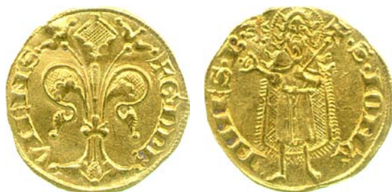
Fig. 3. Dauphiné, Guigues VIII (1319-1333), fiorino d'oro (introdotto nel 1327), gr. 3,39.

Altrettanto significativo è il fatto che frequentemente zecchieri italiani gestirono gli uffici monetari anche quando, dal 1322 in poi, alcune zecche cominciarono a battere fiorini d'oro 'imitativi', sulla falsariga di quello originale di Firenze con il giglio sul dritto e San Giovanni Battista sul rovescio 22 . La prima imitazione del fiorino d'oro di Firenze fu quella promossa da papa Giovanni XXII e realizzata da due maestri lucchesi nella zecca del castello di Ponte della Sorgia, vicino ad Avignone, dal 15 settembre 1322 in poi 23 . Altri italiani, compresi dei fiorentini, furono poi coinvolti nella produzione di fiorini 'imitativi' nel Viennois (Delfinato) per il delfino Guigues VIII (1319-1333) [Fig. 3] 24 , e, molto probabilmente, anche nella Borgogna per il duca Eudes IV (1315-1350) nel 1327 25 , a Gand nelle Fiandre per il conte Luigi I di Nevers (1322-46) nel 1336 26 , a Lubeca nel 1340 [Fig. 4] 27 , a Lienz per i conti di Gorizia nel 1350 28 , a Pont d'Ain vicino a Lione per il 'conte verde' Amedeo VI di Savoia (1343-83) nel 1352 29 , a Liegnitz in Slesia per il duca Venceslao I (1348-1365) 30 , mentre