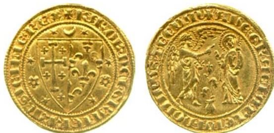
Fig. 2. Napoli, Carlo I d'Angiò (1266-1285), carlino d'oro (introdotto nel 1278), gr. 4,34.

Altrettanto significativo è il fatto che frequentemente zecchieri italiani gestirono gli uffici monetari anche quando, dal 1322 in poi, alcune zecche cominciarono a battere fiorini d'oro 'imitativi', sulla falsariga di quello originale di Firenze con il giglio sul dritto e San Giovanni Battista sul rovescio 22 . La prima imitazione del fiorino d'oro di Firenze fu quella promossa da papa Giovanni XXII e realizzata da due maestri lucchesi nella zecca del castello di Ponte della Sorgia, vicino ad Avignone, dal 15 settembre 1322 in poi 23 . Altri italiani, compresi dei fiorentini, furono poi coinvolti nella produzione di fiorini 'imitativi' nel Viennois (Delfinato) per il delfino Guigues VIII (1319-1333) [Fig. 3] 24 , e, molto probabilmente, anche nella Borgogna per il duca Eudes IV (1315-1350) nel 1327 25 , a Gand nelle Fiandre per il conte Luigi I di Nevers (1322-46) nel 1336 26 , a Lubeca nel 1340 [Fig. 4] 27 , a Lienz per i conti di Gorizia nel 1350 28 , a Pont d'Ain vicino a Lione per il 'conte verde' Amedeo VI di Savoia (1343-83) nel 1352 29 , a Liegnitz in Slesia per il duca Venceslao I (1348-1365) 30 , mentre