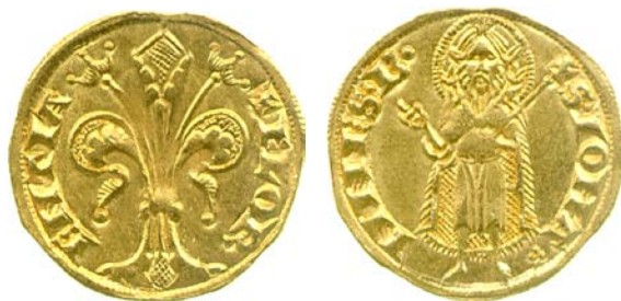
Fig. 1. Firenze, Repubblica, fiorino d'oro battuto a S. Jacopo al Serchio nel 1256, gr. 3,54. Si veda Giovanni Villani, Nuova cronica , a cura di Giuseppe Porta, Parma 1991, 3 voll., I, p. 355 (vii.62). Tutte le monete qui illustrate appartengono al Museo Fitzwilliam, Università di Cambridge.

Con questo articolo intendiamo iniziare a colmare tale vuoto, sia delineando alcuni possibili percorsi di ricerca, sia, soprattutto, introducendo un progetto finalizzato ad uno studio dettagliato del fenomeno e fondato su una specifica banca dati di respiro europeo. Nello stesso tempo, l'analisi dei dati già raccolti sui maestri italiani nelle zecche straniere ci consentirà di offrire un primo tentativo di sintesi e di approfondimento sulla materia e di cogliere i retroscena delle attività degli zecchieri, inquadrando l'intero fenomeno nel contesto della cosiddetta «rivoluzione commerciale del medioevo» 8 .