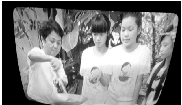
รายการโทรทัศน์ “ขนมไทย อะไรเอ๋ย”

18) สื่อมวลชนต่างๆ เช่น วิทยุ เครื่องรับโทรทัศน์ อินเทอร์เน็ต หนังสือพิมพ์ วารสาร นิตยสาร ซึ่งมีรายการต่างๆ ทั้งสารคดี สุขภาพ อนามัย การทำอาหาร การประดิษฐ์สิ่งของต่างๆ การสอนภาษาอังกฤษ เป็นต้น