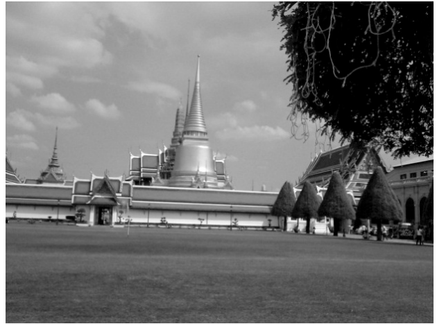
วัดพระศรีรัตนศาสดาราม

18) สื่อมวลชนต่างๆ เช่น วิทยุ เครื่องรับโทรทัศน์ อินเทอร์เน็ต หนังสือพิมพ์ วารสาร นิตยสาร ซึ่งมีรายการต่างๆ ทั้งสารคดี สุขภาพ อนามัย การทำอาหาร การประดิษฐ์สิ่งของต่างๆ การสอนภาษาอังกฤษ เป็นต้น