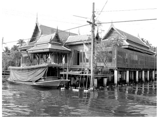
เรือนไทย

6) สถาปัตยกรรมพื้นบ้าน เช่น เรือนไทย เรือนคหบดี กุฏิสงฆ์ เรือนร้านค้าริมน้ำ เรือนแพ เรือนร้านค้าริมทาง เรือนเครื่องผูก เรือนกาแล หอ ระฆัง ฯลฯ