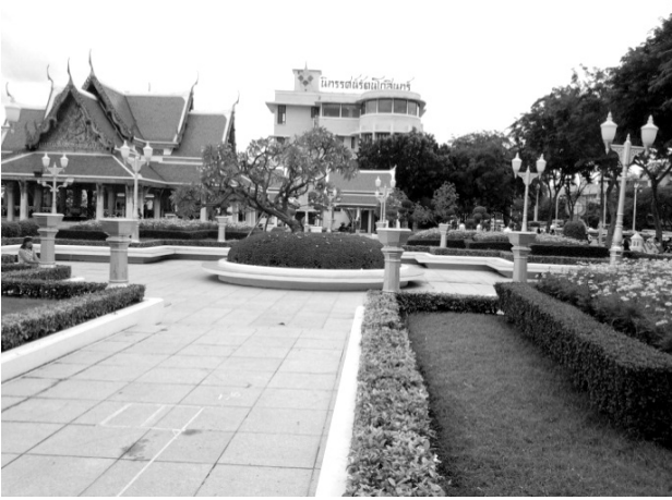
นิทรรศน์รัตนโกสินทร์

การบริหารทรัพยากรเหล่านี้อาจทำได้หลากหลาย เช่น พานักเรียนไปทัศนศึกษา ให้นักเรียนไปค้นคว้าหาข้อมูล ไปสัมภาษณ์ ไปเรียนรู้ และฝึกปฏิบัติกับปราชญ์ชาวบ้าน ให้ช่วยกันอนุรักษ์ ฯลฯ