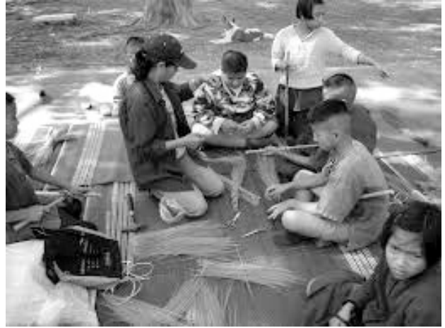
ช่างทอเสื่อ

2) องค์กรภาครัฐ เช่น หน่วยงานของรัฐบาลและรัฐวิสาหกิจ เช่น โรงเรียน วิทยาลัย มหาวิทยาลัย ศูนย์การศึกษาออกโรงเรียน วัด อำเภอ จังหวัด สภาวัฒนธรรม เทศบาล อบต. เป็นต้น