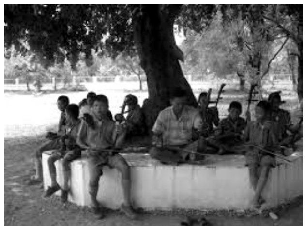
การเล่นซอคู่

10) ดนตรีพื้นบ้านและเพลงพื้นบ้าน เช่น การเล่นซอคู่ เพลงกล่อมเด็ก เพลงเกี่ยวข้าว เพลง ระบำบ้านไร่ เพลงเรือ เพลงประกอบการเล่นของ เด็ก ฯลฯ