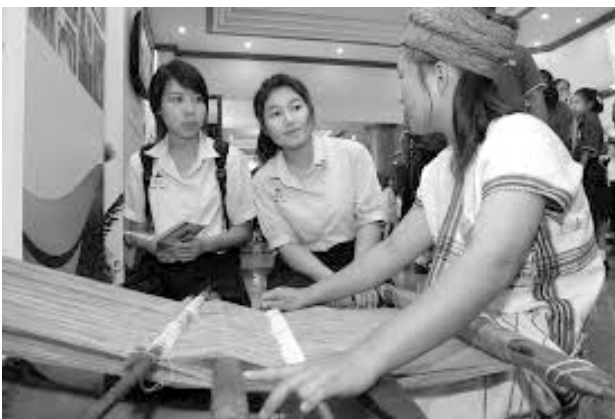
ช่างทอผ้า

2) ภูมิปัญญาชาวบ้าน เช่น พระภิกษุ เกษตรกร (ชาวนา ชาวไร่ ชาวสวน) กลุ่มแม่บ้าน แพทย์แผนไทย แพทย์ประจำตำบล อสม. ช่างก่อสร้าง ช่างจักสาน ช่างทอผ้า ช่างทอเสื่อ ช่างตัดผม ช่างทำผม ช่างตัดเสื้อ นักแสดงละคร นักดนตรี สมาคมและชมรมต่างๆ พ่อค้า ฯลฯ