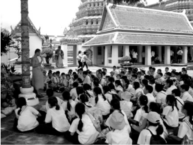
พระภิกษุ

1) ผู้ที่ทำงานเกี่ยวข้องกับโรงเรียน เช่น ครู พระภิกษุ นักเรียน ผู้ปกครอง นักเรียน