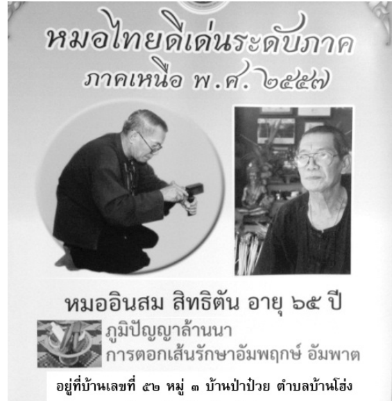
หมอพื้นบ้าน

2) ผู้ที่ทำงานเกี่ยวข้องกับโรงเรียนโดยอ้อม คือผู้ที่มุ่งช่วยเหลือเพราะศรัทธา ต่อบุคลากร หรือการดำเนินกิจการของโรงเรียน หรือผู้มีจิตกุศลทั้งหลาย เช่น พระภิกษุ ศิษย์เก่า อาสาสมัครในชุมชน ประชาชนชาวบ้าน หมอพื้นบ้าน ฯลฯ