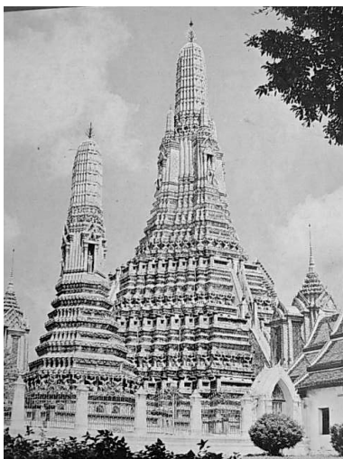
วัดอรุณราชวราราม

17) วัด เช่น วัดเจติยหอย วัดสิงห์ วัดพระธรรมกาย วัดไร่ล่อม วัดพระศรีรัตนมหาธาตุ วัดอรุณราชวราราม วัดพระศรีรัตนศาสดาราม เป็นต้น