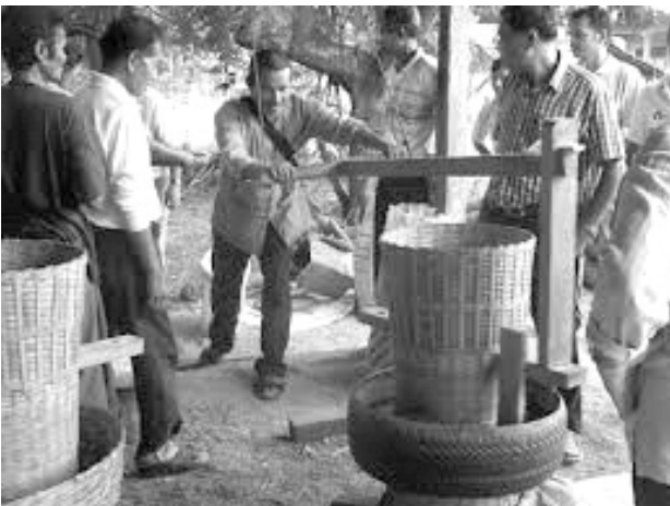
เครื่องมือสีข้าว

6) สถาปัตยกรรมพื้นบ้าน เช่น เรือนไทย เรือนคหบดี กุฏิสงฆ์ เรือนร้านค้าริมน้ำ เรือนแพ เรือนร้านค้าริมทาง เรือนเครื่องผูก เรือนกาแล หอ ระฆัง ฯลฯ