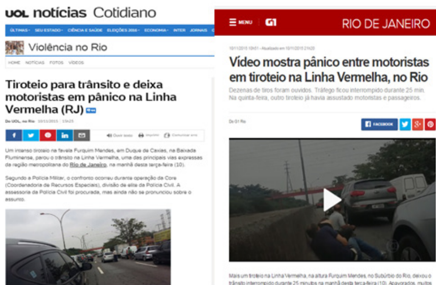
Figura 4: Exemplos de circulação referente ao vídeo de instituição midiática

O flagrante do tiroteio pode ser encontrado na íntegra, editado, fundido com outros vídeos, acompanhado ou não de texto jornalístico (Figura 4).