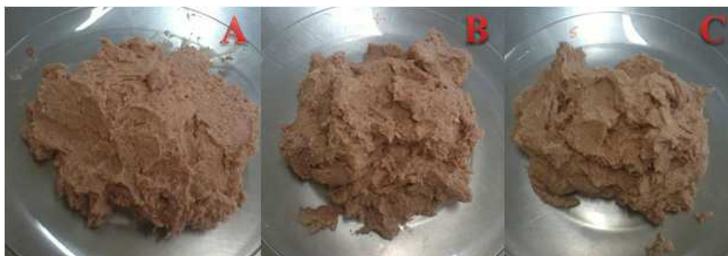
Figura 2 – Massa de mortadelas A, B e C.

Visualmente percebe-se diferença na coloração e na consistência das massas e, de acordo com Dias (2007), a alteração na consistência deve-se, principalmente, à propriedade tecnológica das fibras vegetais empregadas em formulações de produtos cárneos de absorver a água que foi adicionada para facilitar a formação da emulsão entre a proteína miofibrilar da carne e a gordura animal.