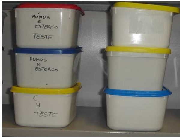
Figura 2- Minhocário vertical

Todos os minhocários continham esterco na composição e os ensaios controle (sem Cd) foram identificados por húmus em minhocários verticais (HV) e húmus em minhocários horizontais (HH). Os minhocários contendo Cd foram identificados como: HV+Cd e HH+Cd.