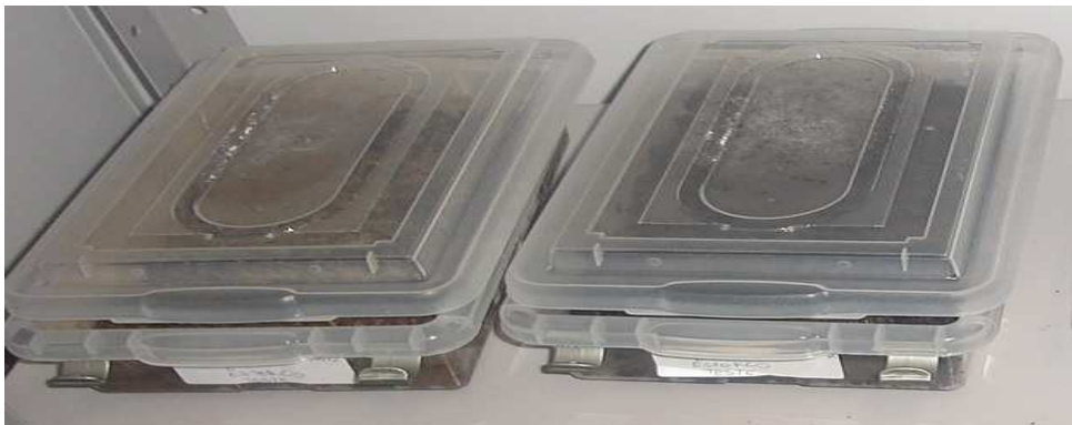
Figura 1-Minhocário horizontal

O mesmo tratamento foi adotado para os minhocários verticais logo sendo construídos por três recipientes plásticos com dimensões 10 cm x 10 cm x 17 cm, contendo tampas, conforme Figura 2. As duas partes superiores do minhocário receberam no total 10 minhocas, 5 delas em cada compartimento.