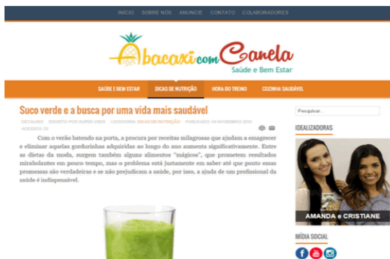
Figura 2 - Página a notícia que apresenta informações sobre nutrição e conteúdo dinâmico que ensina fazer uma receita.

Pensando nisso, o propósito deste trabalho foi de estruturar uma nova forma de se desenvolver a comunicação em saúde. No qual, nota-se que sofre por inúmeras carências e enfrenta diversos desafios. Em especial, na complexa relação das fontes de informações especializadas em saúde com os profissionais da