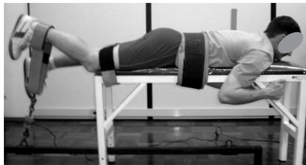
Figura 2 - Teste de força para isquiotibiais.

No TF IT, foi realizado o teste de flexão lateral do tronco, 6 adaptado para a utilização da célula de carga. Para este teste, o indivíduo foi posicionado em decúbito lateral, com os membros inferiores, pelve e abdômen apoiados sobre um banco, com um travesseiro separando os joelhos