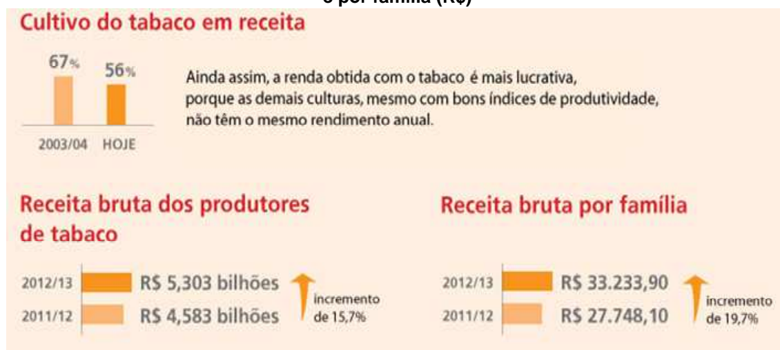
Figura 2 – Cultivo do tabaco em receita (percentual) e Receita bruta dos produtores de tabaco e por família (R$)