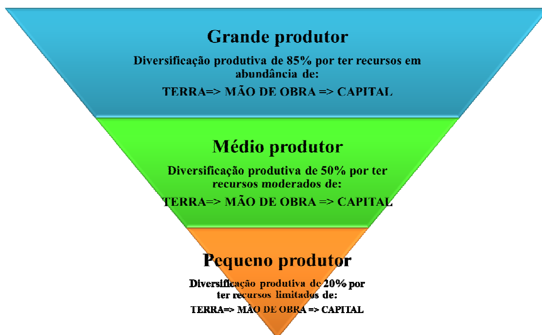
Figura 3 - Capacidade de diversificação produtiva do pequeno, médio e grande produtor cooperado da CTJ (2013)