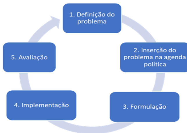
Figura 2: Ciclo das políticas públicas

A teoria dos ciclos elenca cinco fases que permitem entender como uma política surge e se desenvolve: (i) percepção e definição do problema; (ii) inserção na agenda política; (iii) formulação; (iv) implementação; e (v) avaliação. 8