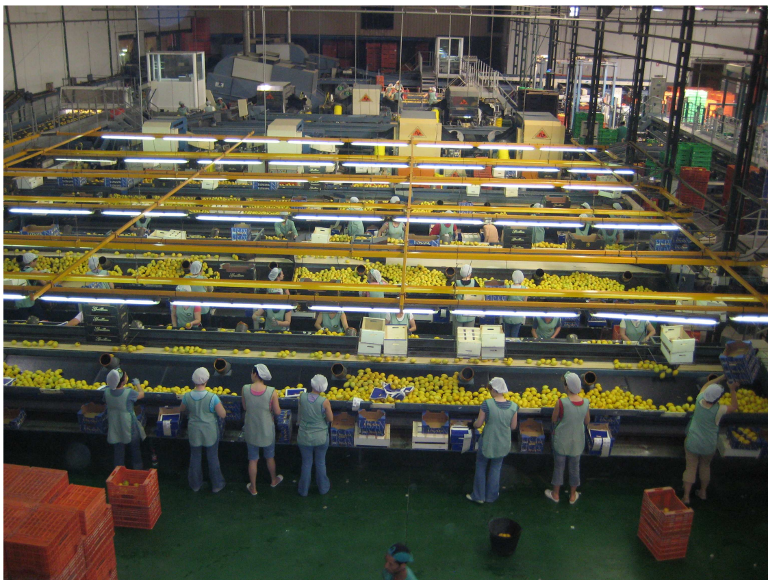
Figura 2. Las campañas de trabajo en almacén (El Limonar. Santomera)

A nivel de la composición de la exportación murciana de frutas, en el periodo 2001-2009 sobresalen: cítricos, melón y sandía, frutas de hueso, y uva de mesa. Sin duda limón y melón ocupan los primeros puestos según volumen, a los que habría que unir la uva de mesa, según valor.