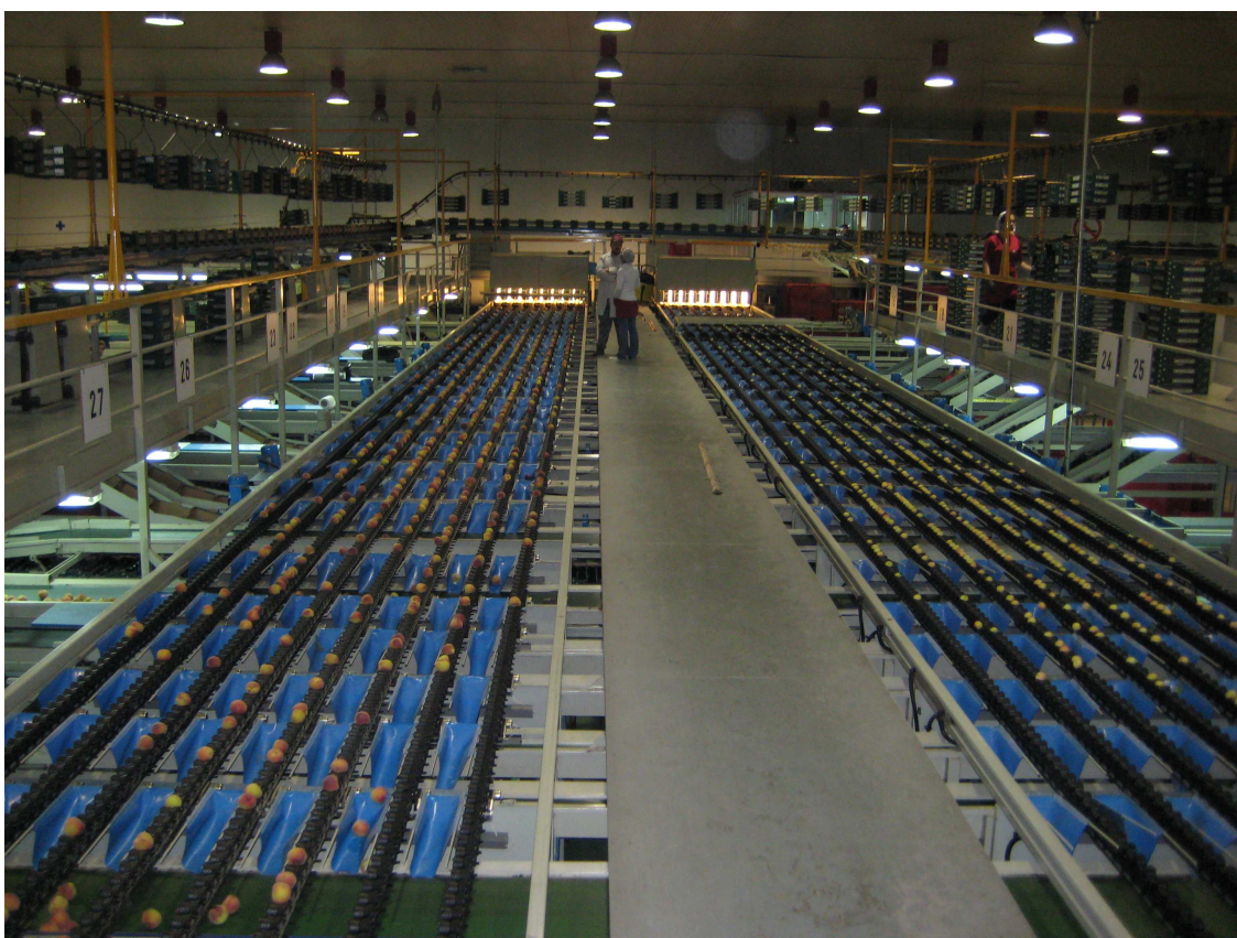
Figura 3. Los procesos de innovación en las centrales hortofrutícolas (Molina de Segura).

La Unión Europea 27 es el principal destino de las exportaciones españolas de frutas y hortalizas. Casi el 94% de la facturación exterior se envía a otros países de la Unión Europea, nuestros principales clientes son Alemania, Francia, Reino Unido Países Bajos, Portugal, e Italia a los que se está incorporando con incrementos importantes anuales Polonia.