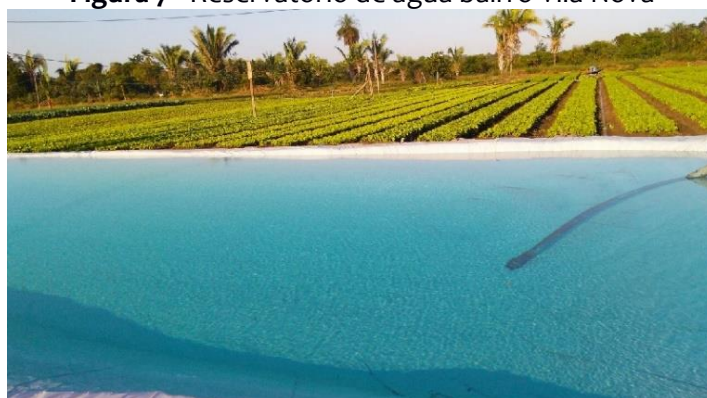
Figura 7 - Reservatório de água bairro Vila Nova

É possível visualizar os investimentos em materiais, estufas e a utilização de toda a área arrendada, assim como a variedade na produção. A agricultura urbana do bairro Vila Nova, conforme dados da pesquisa, é a maior atuação de agricultura urbana no município de Imperatriz (MA), conforme as Figuras 7 e 8.