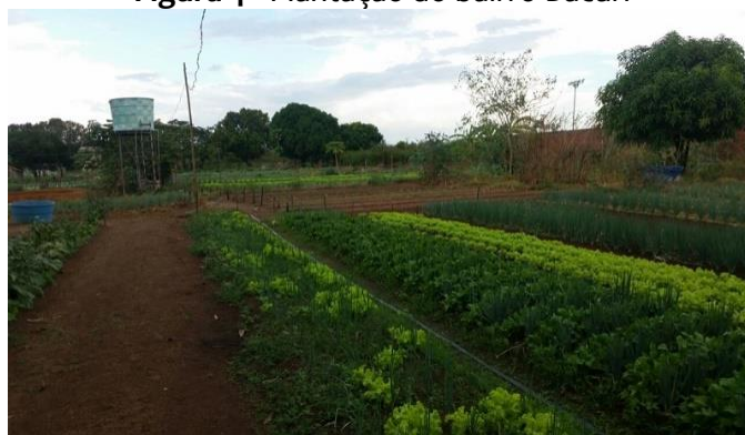
Figura 4 - Plantação do bairro Bacuri

Quanto ao destino da colheita do bairro Vila Nova, conforme Quadro 8, 100% afirmam repassar a colheita para supermercados, feiras, restaurantes e hospitais. Os produtores AUV2, AUV3 e AUV7 fazem diferença no aspecto econômico do município de Imperatriz, pois têm um índice de produção muito alto na região.