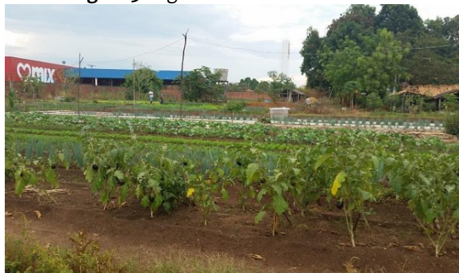
Figura 3 - Agricultura urbana bairro Bacuri

Na Figura 4, a seguir, visualiza-se a área produtiva e suas variedades na ocupação do espaço do bairro Bacuri, assim como a organização e separação por lotes destinados a cada produtor.