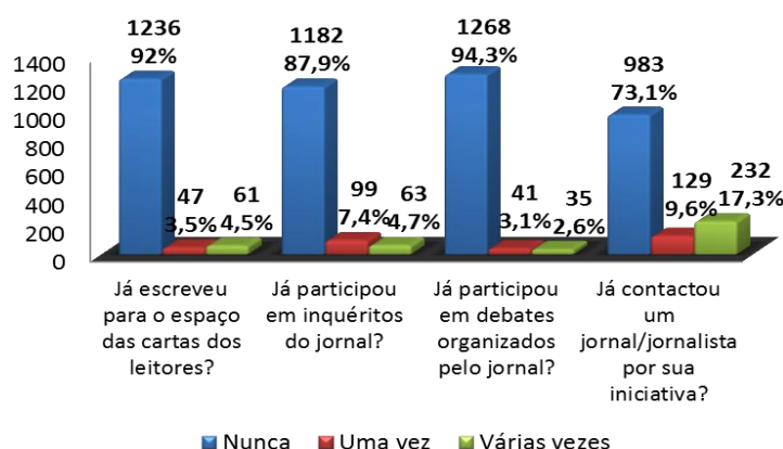
Figura 2 - Participação dos leitores nos diferentes espaços dos jornais

Considerando a participação dos leitores no espaço das cartas ou em outras iniciativas dos jornais, ou até analisando a iniciativa dos entrevistados em contactar o jornal ou os jornalistas, percebeu-se que a maioria dos leitores nunca o fez, indiciando um total afastamento entre os leitores e os jornais. A maioria dos contatos com origem no leitor diz respeito a assuntos relacionados com a assinatura, divulgação de acontecimentos e promoção de iniciativas e negócios.