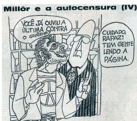
O Pasquim , n. 43, 12 a 18 de fevereiro de 1970, p. 33.

Millôr Fernandes foi um dos principais integrantes d’ O Pasquim que ironizava constantemente a censura imposta às redações, assim como a autocensura da grande imprensa. Na charge abaixo, percebe-se como o desenhista “autocensura-se” e não se atreve a falar contra o governo militar.