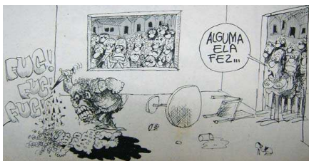
O Pasquim , n. 200, 1 a 7 de maio de 1973, p. 16.

A classe média e sua omissão/conivência foi duramente criticada pelos jornalistas, como na série de charges elaboradas por Henfil, intitulada “Pequeno dicionário da classe média”, na qual a frase “alguma ele fez” permitia às pessoas da classe média se eximirem: