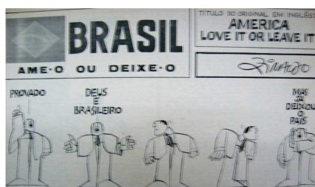
O Pasquim , n. 55, 9 a 15 de julho de 1970, 24.

Uma das críticas feitas ao slogan do “Brasil: ame-o ou deixe-o” era que este não passava de uma cópia da campanha do governo norte-americano em virtude da guerra do Vietnã, em 1968: USA: Love it or leave it”. Além disso, essa campanha promovida pela AERP também visavam ao combate das denúncias à ditadura brasileira que estavam sendo realizadas no exterior, principalmente por parte de exilados. A campanha publicitária governamental foi conteúdo de várias matérias d’ O Pasquim , entre elas, uma série de charges feitas por Ziraldo: como pode o Brasil, que é um país em plena expansão econômica onde há uma democracia na qual não se tortura (como disse o ditador Médici no discurso de posse), ser abandonado pelo seu melhor cidadão, Deus?