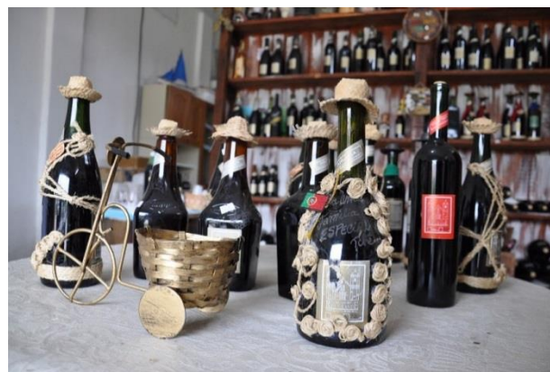
Legenda: Garrafas de Jurupiga enfeitadas com artesanato local.

As entrevistas com atores-chaves do município de Rio Grande mostraram que o processo de construção dos saberes constituem uma parte da história gastronômica da cidade, marcada pela forte influência portuguesa. Observou-se a preservação de técnicas de preparo como no caso do peixe na taquara e na produção da cachaça Jurupiga feitas de maneira artesanal, mantendo as tradições ensinadas pelas gerações passadas. Por outro lado, pode-se verificar o oposto, como no caso do restaurante da pesquisa, cujo proprietário está sempre atento as novidades na elaboração dos pratos como a utilização de forno combinado, tecnologia moderna de cocção, mostrando que a cidade convive com estas duas realidades; a tradição e a modernidade.