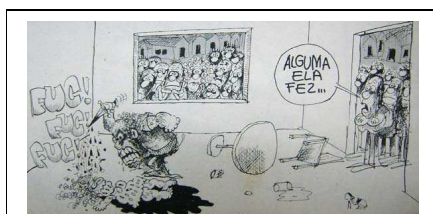
O Pasquim , n. 200, 1 a 7 de maio de 1973, p. 16.

A classe média e sua omissão/conivência foi duramente criticada pelos jornalistas, como na série de charges elaboradas por Henfil, intitulada "Pequeno dicionário da classe média", na qual a frase "alguma ele fez" permitia às pessoas da classe média se eximirem: