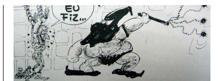
O Pasquim , n. 200, 1 a 7 de maio de 1973, p. 16.

Em nosso entendimento, não é necessário trabalhar com uma profusão de charges. Podemos claramente trabalhar com poucas, devido inclusive ao número de aulas de História cada vez mais exíguo, desde que sejam manejadas de forma consciente e crítica, procurando articular o universo conceitual dos alunos, fato existente, porém ainda não sistematizado, com a realidade histórica. Ademais, seria desnecessário, a nosso ver, trabalhar com charges numa perspectiva apenas lúdica, dado que a sociedade na qual vivemos está sobrecarregada de imagens. O que falta, ainda, em nossa sociedade, é a agudização da capacidade de análise social, e este é um dos principais compromissos que o professor de História deve assumir.