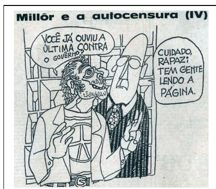
O Pasquim , n. 43, 12 a 18 de fevereiro de 1970, p. 33.

Millôr Fernandes foi um dos principais integrantes d’ O Pasquim que ironizava constantemente a censura imposta às redações, assim como a autocensura da grande imprensa. Na charge abaixo, percebe-se como o desenhista “autocensura-se” e não se atreve a falar contra o governo militar.