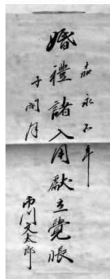
嘉永5年 婚礼諸人用献立覚帳 表紙 (山梨県立博物館所蔵)